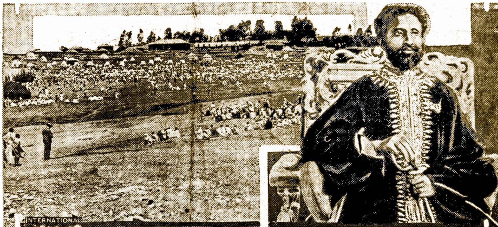
Aną dieną Ras Tafari buvo apvainikuotas kaip Haile Belassie I, etiopiečių Imperatorium, dalyvaujant veik visų šalių atstovams ir dideliai miniai. Paveikslas rodo imperatorių ir palociaus ir lauko vaizdą, ten, kur įvyko iškilmės.