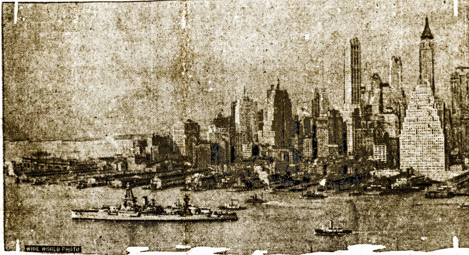
Suv. Valstijų Laivas Texas, laivyno viršininko laivas palkdamas New Yorko aukštus murus užpakaly, plaukia ant East upės, pradedant kelionę į metinius žiemos laiko manevrus, kurie įvyk arti Guantanamo įlankos, Kubos, ir vėliau arti Panamos kanalo.