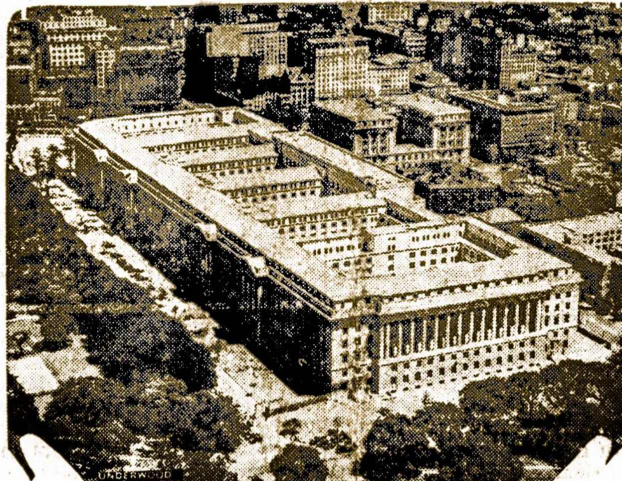
Komercijos skyriaus naujas milžiniškas namas yra užbaigtas ir veik visiškai įtaisytas ir neužilgo bus užimtas. Jisai pastatytas Washingtono, pačiame miesto centre, užima tris miesto blokus į šiaures ir pietus ir vieno bloko plotumo. Jis yra didžiausias federališkas ofisų namas Suvienytose Valstijose.