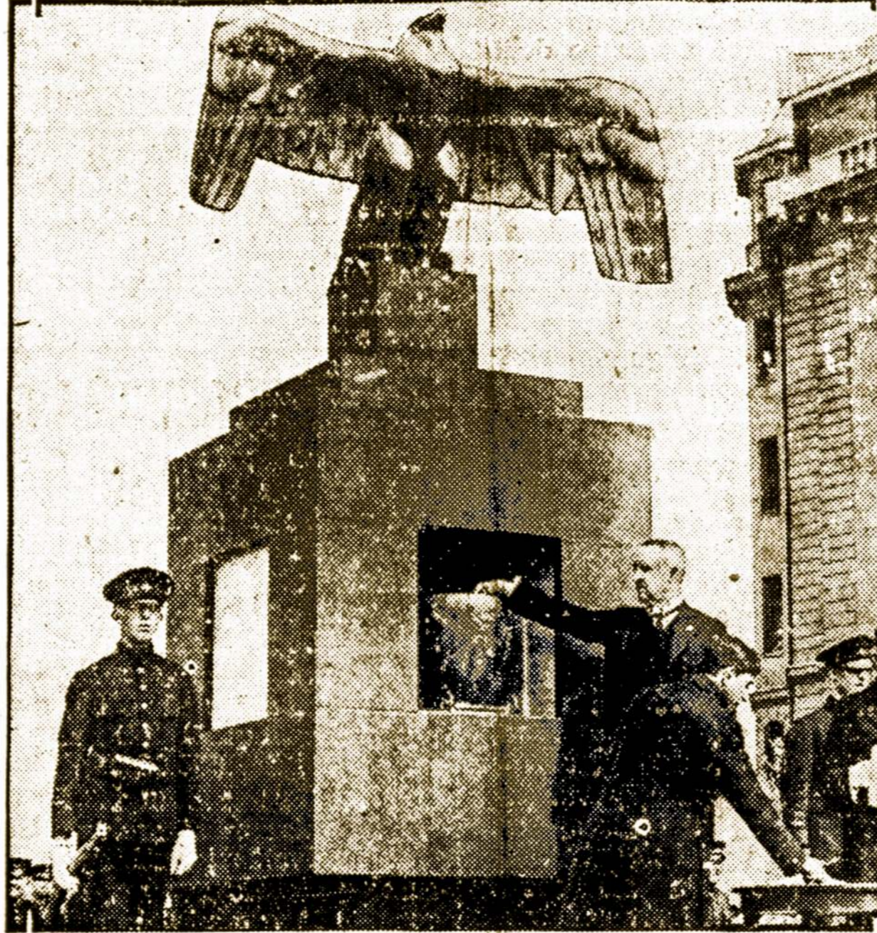
Vaidas laike ceremonijų laike atidengimo paminklo Stockholm mirusiems švedijos lakunams. Švedijos Aero klubas pastatė šį paminklą ir viduje įdėjo urną, kurioj stovi medaliai su vardais žuvusių lakunų.

daryt darbus, viešus darbus soduose, vieškeliuose ar viešų namų statyme, privatiškų darbų namuose, darbai labdarybės organizacijose. Ketvirta, reikia sudaryt lėšų pašalpai ne tik miestui, bet ir privatiškoms įstaigoms.