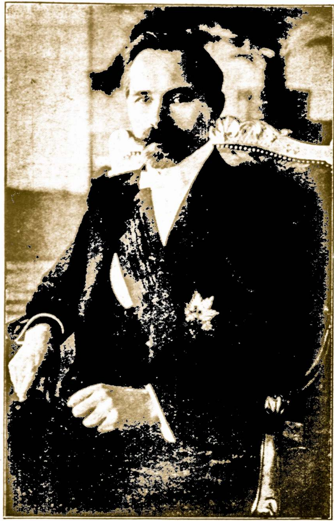
LIETUVOS PREZIDENTAS ANTANAS SMETONA Ypatingų Rinkimų išrinktas 7 metams