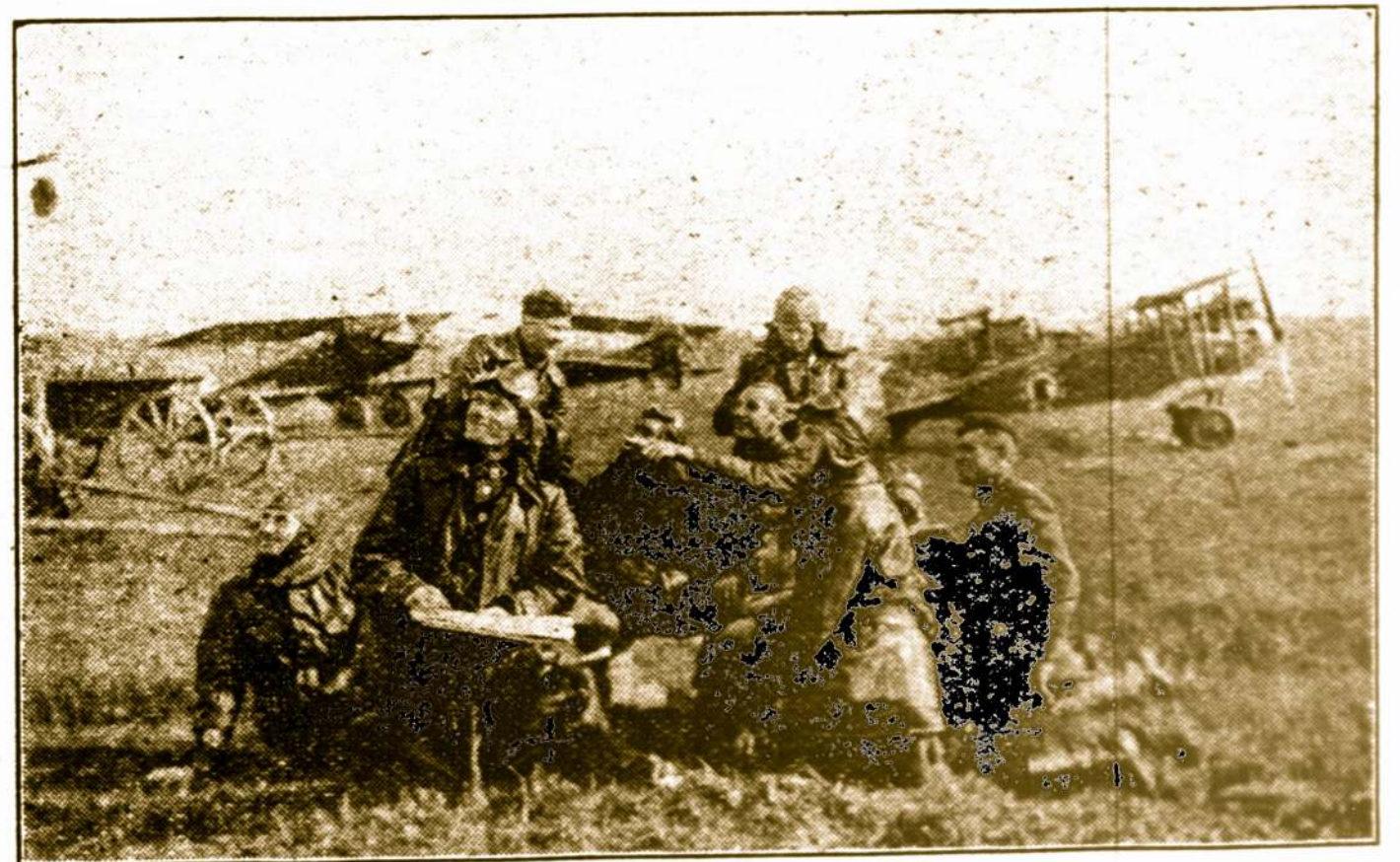
Lietuvos Aviatorių Grupė

Vilnius ir Klaipėda tai du nepriklausomos Lietuvos šulai. Vienam iš tų šulų griuvus ir kitam sunku bus atsilaukyti. Sugriuvus abiem—grius ir Lietuva.