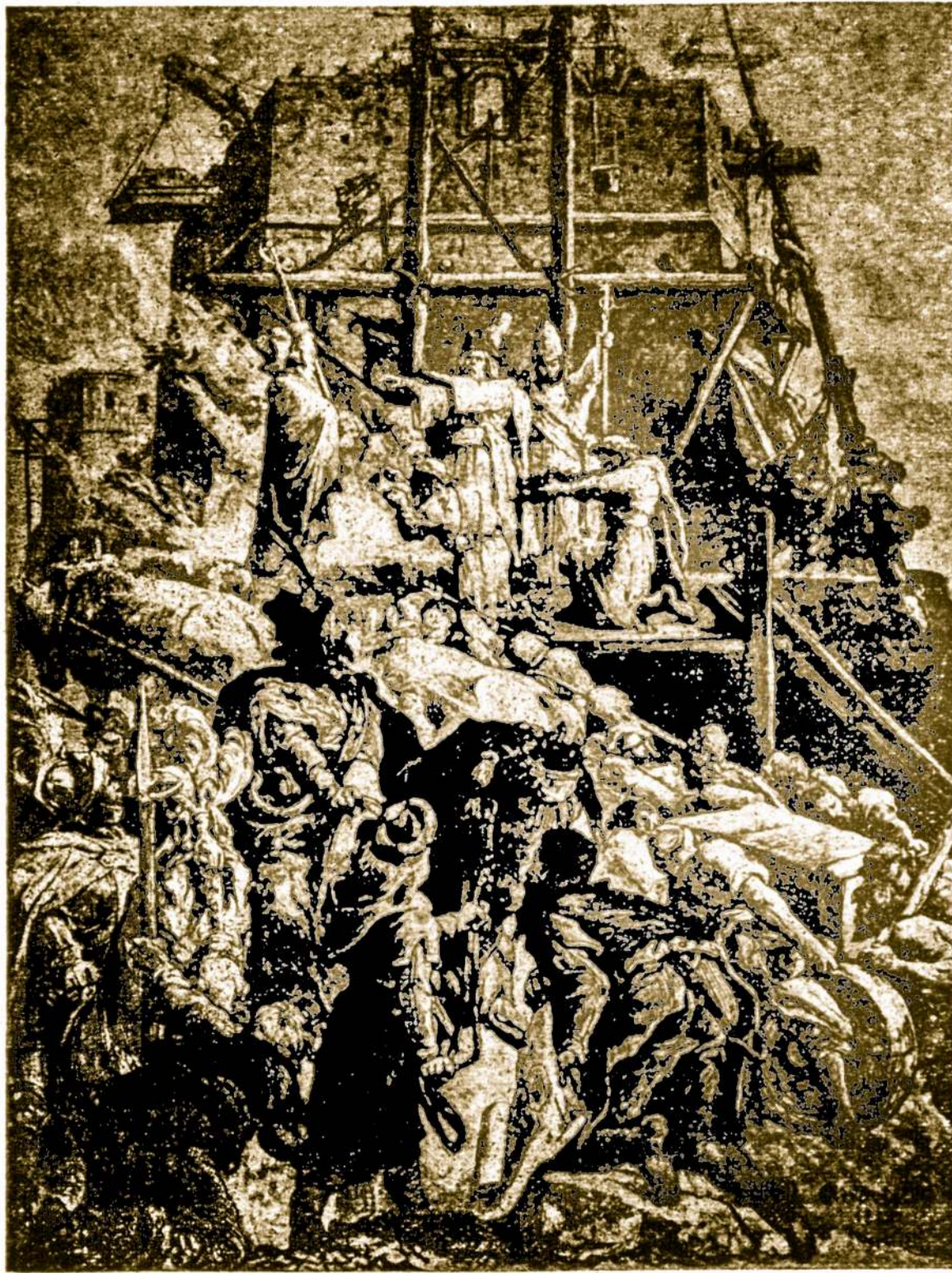
Didysis Lietuvos Kunigaikštis Gediminas kuria Lietuvos sostinę Vilnių, kurio vadavimas iš lenkų okupacijos yra vyriausias Lietuvos tautos siekimas

Delto tautos taip teritoriją brangina. Kas yra Prancuzijai Elzas Lotaringija? Visai nedidelis žemės sklypas, sudarės vis 2,63% visos teritorijos. Vadina-si, Elzas Lotaringija Prancuzijai reiškia tiek, kiek Lietuvai du valščiai, gulį kur nors pasieny. Ir tiems dviem valščiam atvaduoti Prancuzija 40 metų ruošėsi karui, rizikavo iškelti pasaulinį karą, statė mažne visą savo egzistaciją ant kortos, paklojo daugiau dviejų milijonų