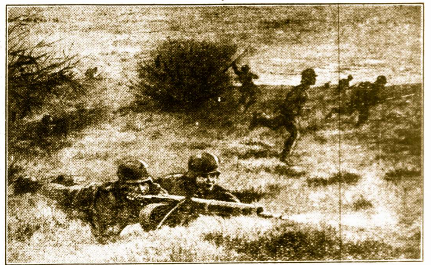
Kovoja už Lietuvos Nepriklausomybę

Išvaduosime ir mes, jeigu eisiam jų nurodytais keliais. O vaduoti reikia. Reikia Vilnių vaduoti, nes be Vilniaus—nėra Lietuvos!