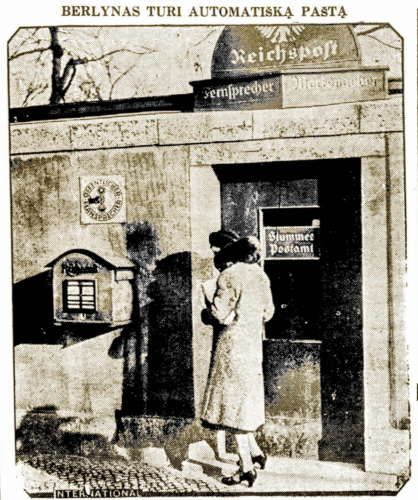
Čia Berlyno automatiškas paštas, kuris neseniai atsidarė. Automatiška mašina paduoda visokių kainų markutes ir telefono buda atsidaro automatiškai.