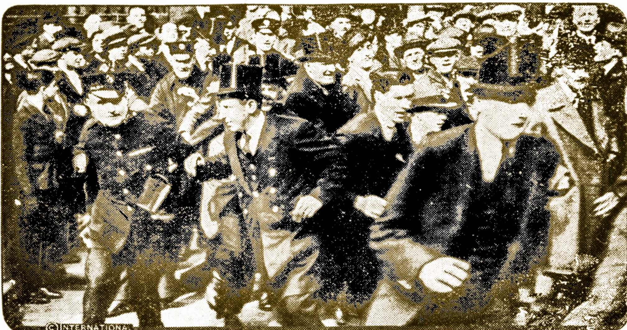
Šis paveikslas rodo sujudimą Londono finansiskame distrikte, kad sužinota jog Anglijos Bankas nutarė sumažint atskaitymo ratą iki 4-to nuosimčio. Banko pasiuntiniai su aukštom kepurėm, kaikurie su sargais, eina pranešt tą linksmą žinią.