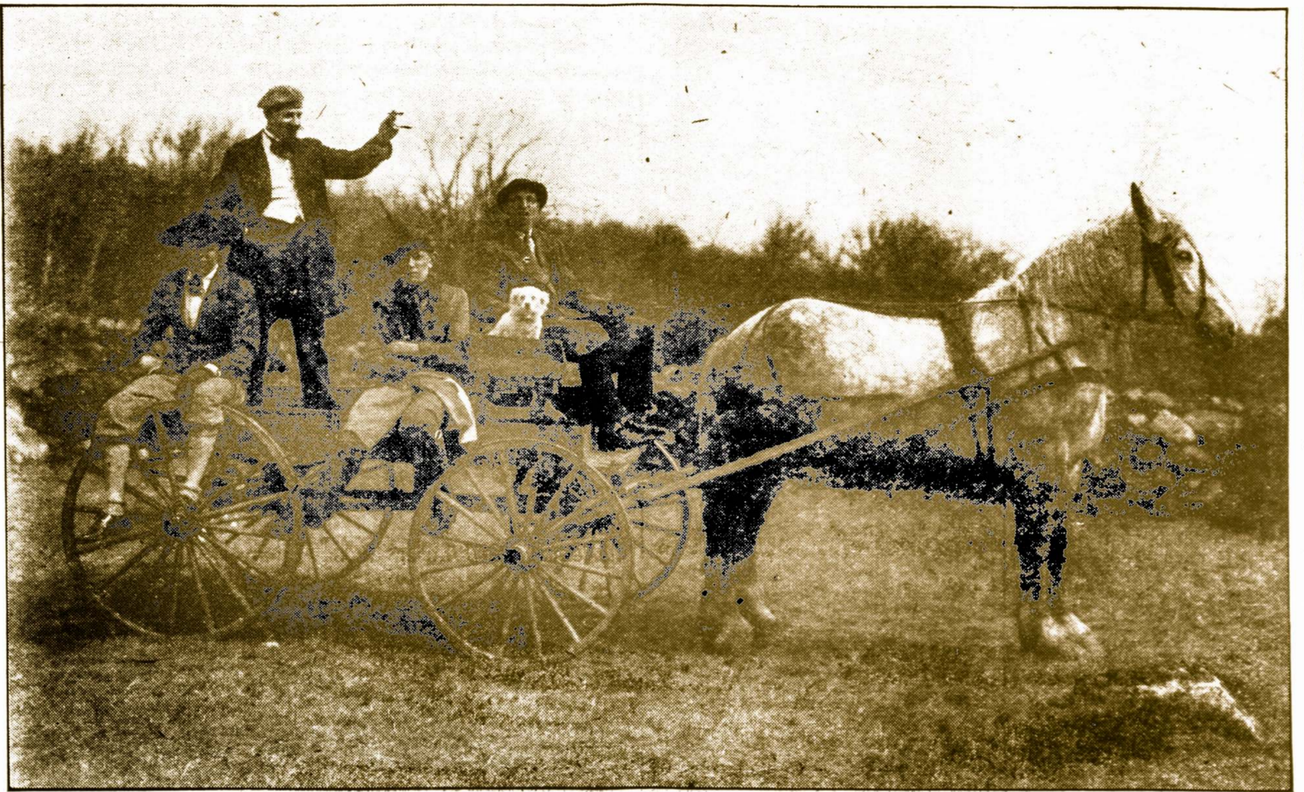
“MES KETURI”, KURIE VAIDINS VEIKALĄ “ŠIAUČIUS”

Vietos dailės ir meno draugija Aušrelė rengiasi prie didelio programo, kurs bus perstatytas sekmadienyje, balandžio 17-tą, Lietuvių Ukėsų Klubo Svetainėje, šalia Amerikos Lietuvių. Koncertinė dalis programo ir vaidinimas veikalo “Šiaučius”