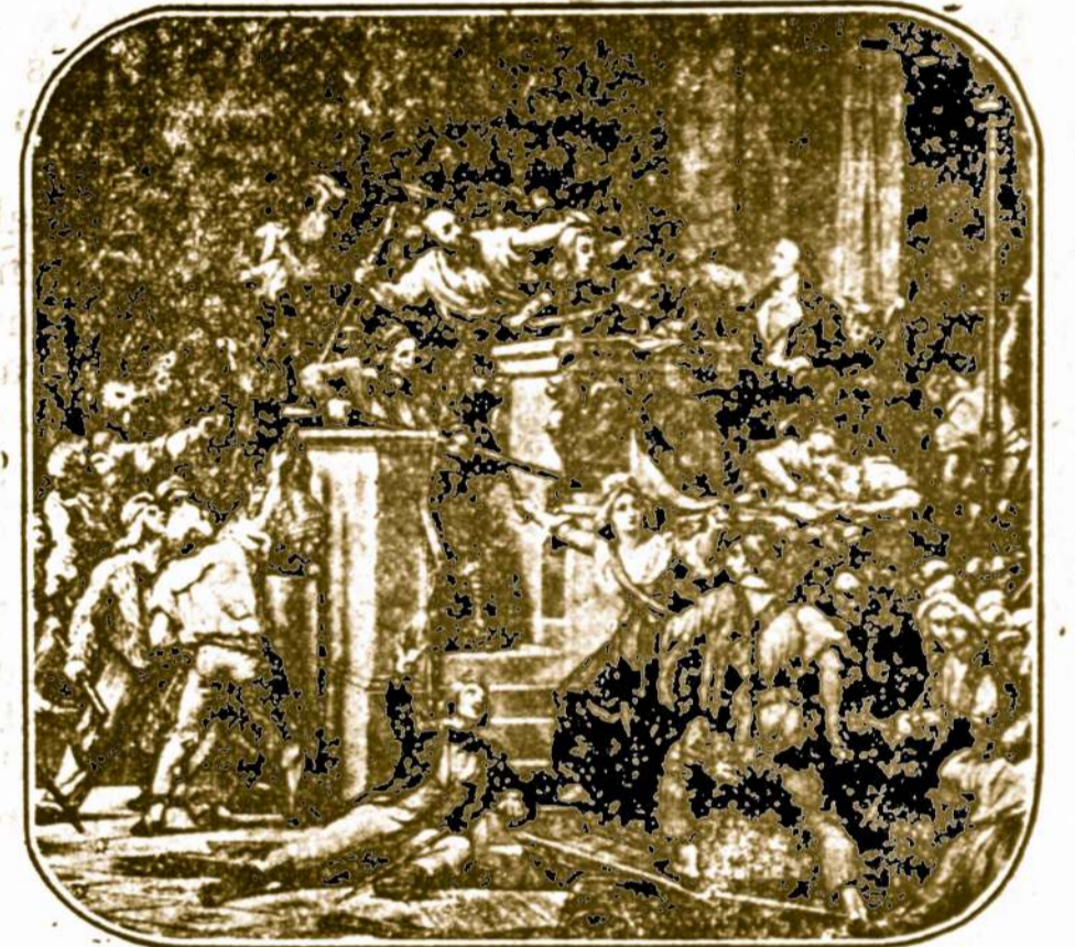
Britanijos Karalienė šaukia į karę prieš romėnus Riaušės del duonos Francijos revoliucijoje