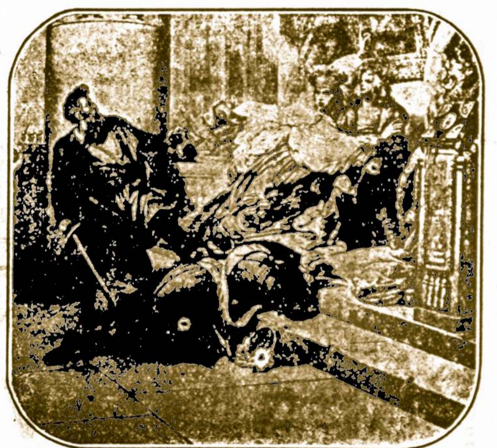
Anglo-saksonai atvyksta į Britaniją Karalienė Natalija išgelbsti savo sunaus gyvastį

Tos knygos padarymas lėšavo virš dviejų tukstančių dolerių ($2,000.) Bet dabar, norėdami "Amerikos Lietuvį" išplatinti, atiduodam ją savo skaitytojams už DYKĄ. Užtaigi kviečiame visus mūsų skaitytojus ir rėmėjus ateit mums į talką išplatinti "Amerikos Lietuvį" tarpe čia bei užsieny gyvenančių savo draugų pažįstamų. "Amer. Lietuvio" prenumeratos kaina užsieny truputį didesnė, todėl maloniai prašome jos prisilaikyt: į Kanadą — $2.50; į Lietuvą — $3.00 metams, su Dovanomis ir persiuntimu.