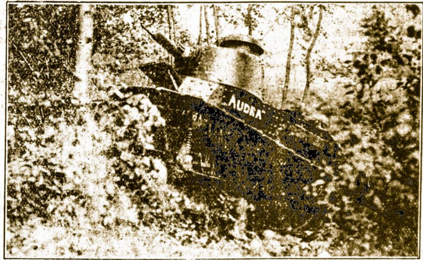
Lieuvos kariuomenės tanka "Audra", šliaužia per tankumynus