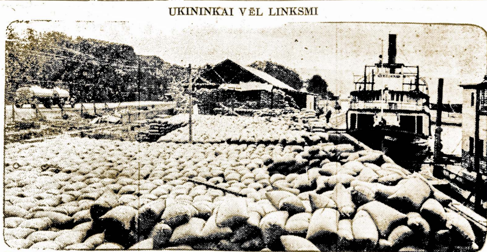
Linksmos dienos sugryžo ukininkams Oregon, Washington ir Idaho valstijoms. Karės sudraskyta Kinija reikalauja labai daug kviečių ir kasdien tukstančiai bušelių buna jai išsiusti. Taip daug yra reikalaujama, kad nėra daugiau vietos sudėti kviečius į sandelius, tai sudeda maišus lauke kol laivas nenuvės į rytus.

Visa eilė mokslininkų ir rašytojų, Volterio ir Ruso bendralaikų, — Dalamberas, Didro, Monteskjė ir kiti — ėmėsi sudaryti bendromis pastangomis "Didžiąją mokslų ir menų enciklopediją". Tame kurinyje bu-