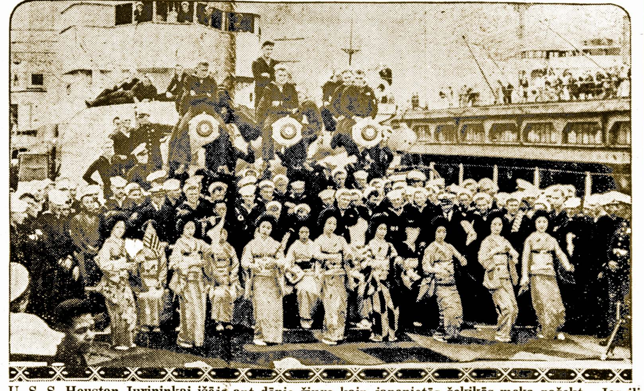
U. S. S. Houston Jurininkai iššę ant dėnio žiuro kaip japonietės šokikės moka pašokt. Jos ilpo į laivą Japonijos vandenyse.