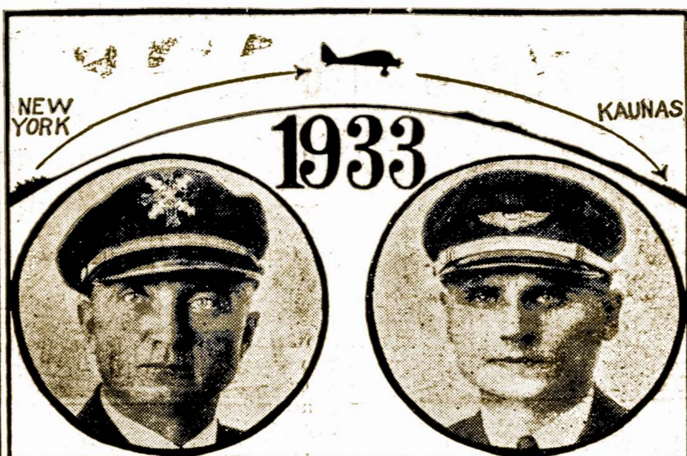
Kap. Darius ir Lak. Girėnas, kuriu skrido iš New Yorko Kaunan ir žuvo Soldino apeliokėje, Vokietijoje; nelaimės priežastis dar iki šiolai nepasisekė tikrai patirt.

Resolved, that we ask the United States Government through its official channels to investigate and make public the