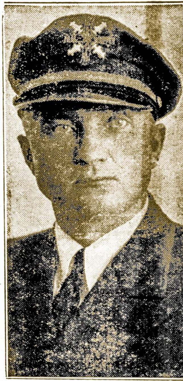
KAP. S. DARIUS

Ką tik Victor Kompanija išleido nepaprastus Dariaus Girėno rekordus, Lietuvos vėliavos spalvos. Vieno rekordą pusėj stovi Darius-Girėnas su savo orlaiviu, o kitoj rekordą pusėj jau jų laidotuvės Kaune.