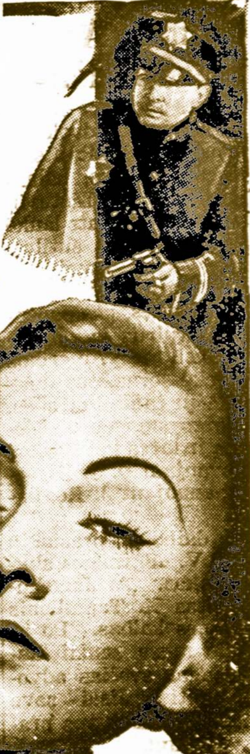
JOS BUČKIAI paukštino jį — prakeikė jį — išgelbėjo jį!

Niekuomet Pirmiau Nebuvo Tokio Paveikslas! Nusistebėsite Pamatę ir Išgirde Paul Muni Kalbant Slovakų Kalboje, Dainuojant Slovakų Dainas ir Šokantį Slovakų Šokius. Turinys Paimtas iš Žymios Pasakos "Jan Volkanik"