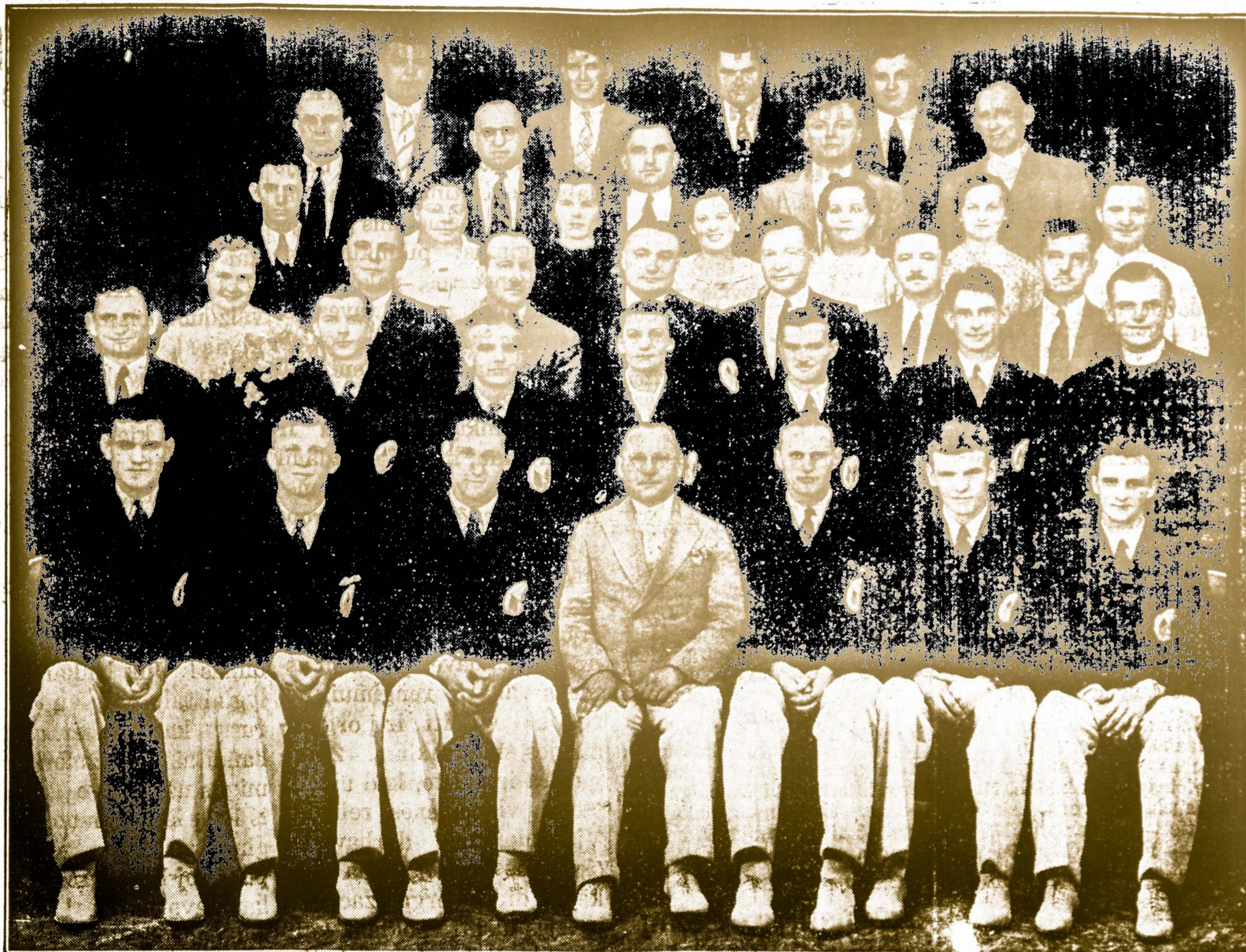
Amerikos Lietuvių Sportininkų Istoriska Kelionė Lietuvoje

Daugelis laukia, kad naujam, pasauliniam karui prasidedant, kaip iš gausybės rago pasipils įvairūs nauji ginklai. Tačiau pasaulis nuo to laiko, kai Kainas pradėjo karą su Abeliu, jau labai daug karų matė, ir prieš kiekvieną karą žmonės laukė kokių nors nepaprastų ginklų pasirodymo. Tačiau ne vieną kartą šie laukimai neišsipildė. Į paskutinį didįjį karą valstybės išėjo su tais ginklais, kurie jau nesudarė jokio netikėtumo. Iš šautuvų dižiamam kare bene geriausias buvo vokiškas, iš kulkosvaidžių — anglų — vokiečių — rusų Maximas, iš lauko patrankų — prancūzų 75 mm, o juk visi šie ginklai buvo išrasti, o daugelis ir pagaminti dar XIX amžiuje. Šiandien, kaip ir prieš kiekvieną karą, sklinda gandų apie naujus išradimus, viską verčiančius aukštyn kojomis. Bet jei tokių išradimų būtų, tai kuriam reikalui visos valstybės, nors ir baisiausios krizės spaudžiamos, iš paskutiniųjų liedintųsi patrankas, dirbtūs šautuvus, sviedinius, bombas, kulkosvaidžius? Ar neišmintingiau būtų, pav., vokiečiams spiauti į visus šiuos tariamai pasenusius ginklus, del kurių išsigijimo jiems dabar tenka kietai veržti pilvą, ir pasigaminti sau tų nepaprastų dujų ar spindulių, apie kurių