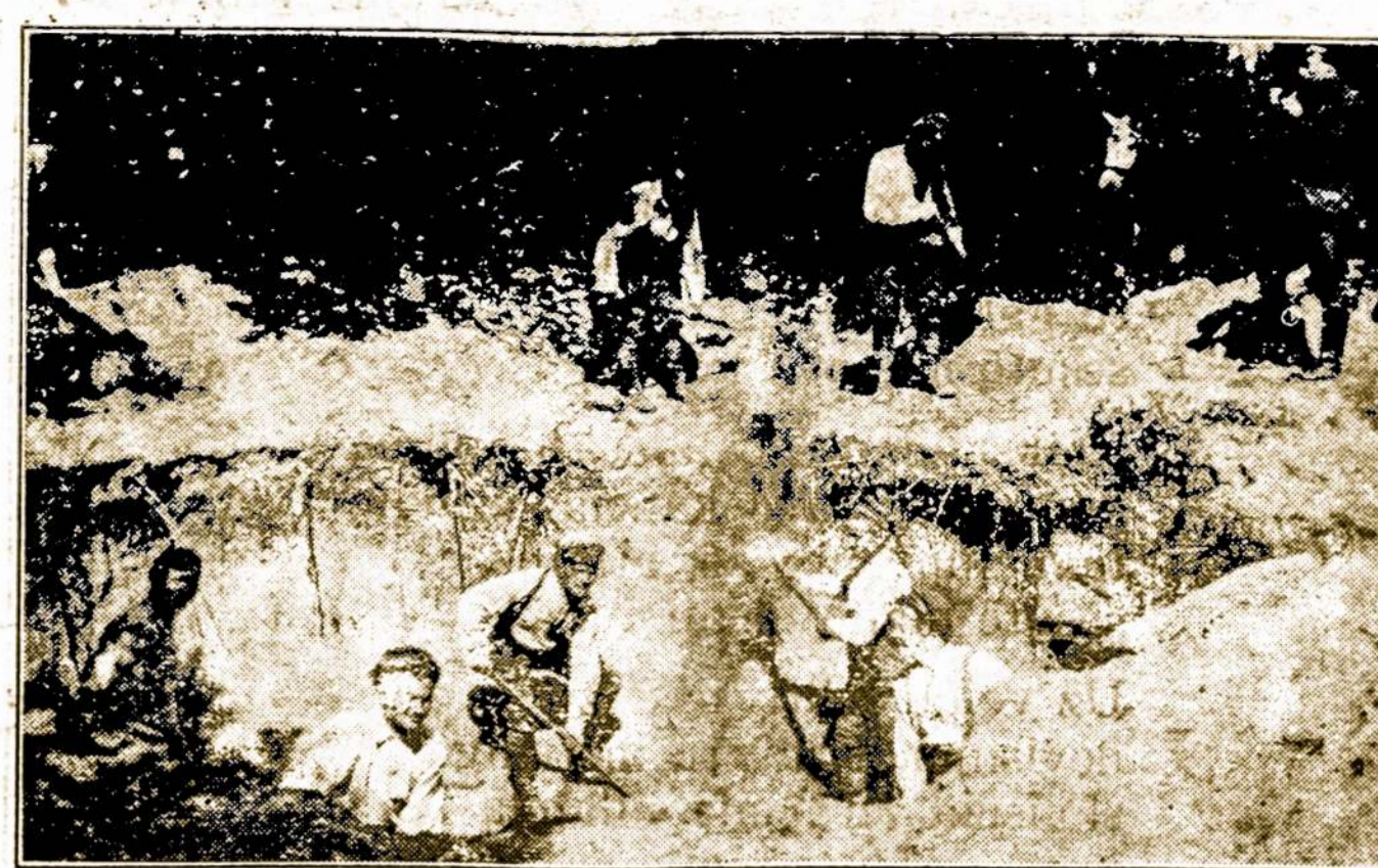
Lietuvos Kareiviai Kasa Apkasus Ties Vieviu, Kovoje su Lenkais