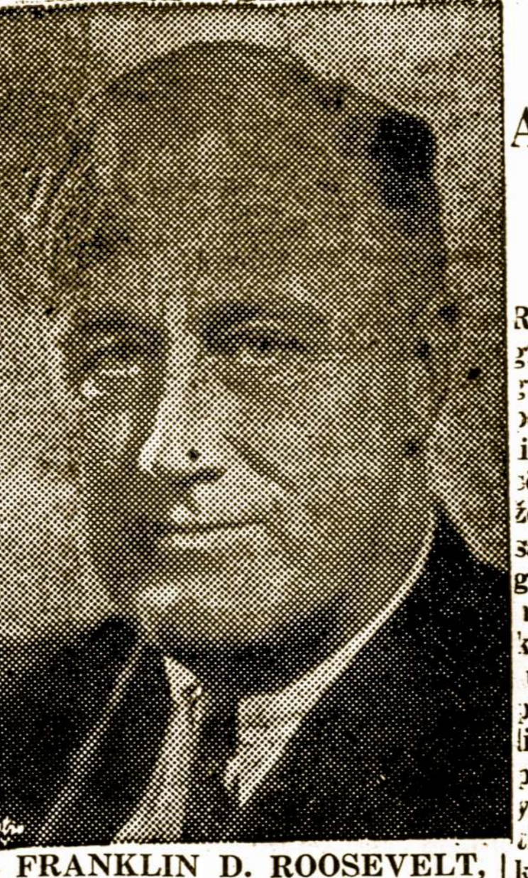
FRANKLIN D. ROOSEVELT, kuris veda kampaniją prieš didįjį truštą

2,666 korporacijų išmokėjo biržos nariams $2,900,000,000 dividendų. Ši suma lyginasi 1931 metų sumai. Batų išdir- bystės pagamino $368,000,000 poras čeverykų; 1929 metais čev- verykų buvo pagaminta 6,500- 000, o 1934 tiktai 11,000,000 po- rų. Abelnai, kur nepažvelgsi, ten pamatysi, kad šalies preky- ba kyla ir produkcija didėja bi- le kurioje praomnės šakoje, ir su dideliu spartumu ir neretai 50 nuošimčių.