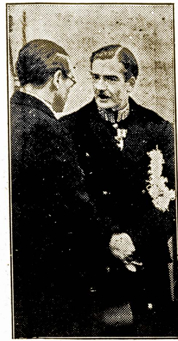
EDEN PAGERBĖ VOKIETIS Anglų Užsienio Sekretorius ėmė dalyvumą Vokietijos ambasadoriaus Anglijai laidotuvėse.

Aš aplankiau 5 valstybes Europoje, buvau jųj sostinėse ir kituose miestuose, turėjau visokių reikalų kaip keliauninkas