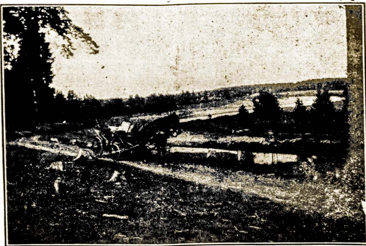
Lietuvos vaizdas pavasary

Šioje, byloje teismas pašaukė 128 liudytojus ir 13 ekspertų. Teisiamuosius gina 16 garsių Lietuvos advokatų. Prieš juos nukentėjusieji pateikė apie 5 milijonus litų civilinio ieškinio, kurį teisme palaiko ir prašo priteisti keli nukentėjusių įstaigų ir asmenų advokatai. Byla Lietuvos visuomenėje kelia gyvo susidomėjimo, nes dar visi gerai atmena garsiąją Lietuvos ukininkų sąjungos veiklą ir jos skandalinę, daug skriaudų padariusį bankrotą.