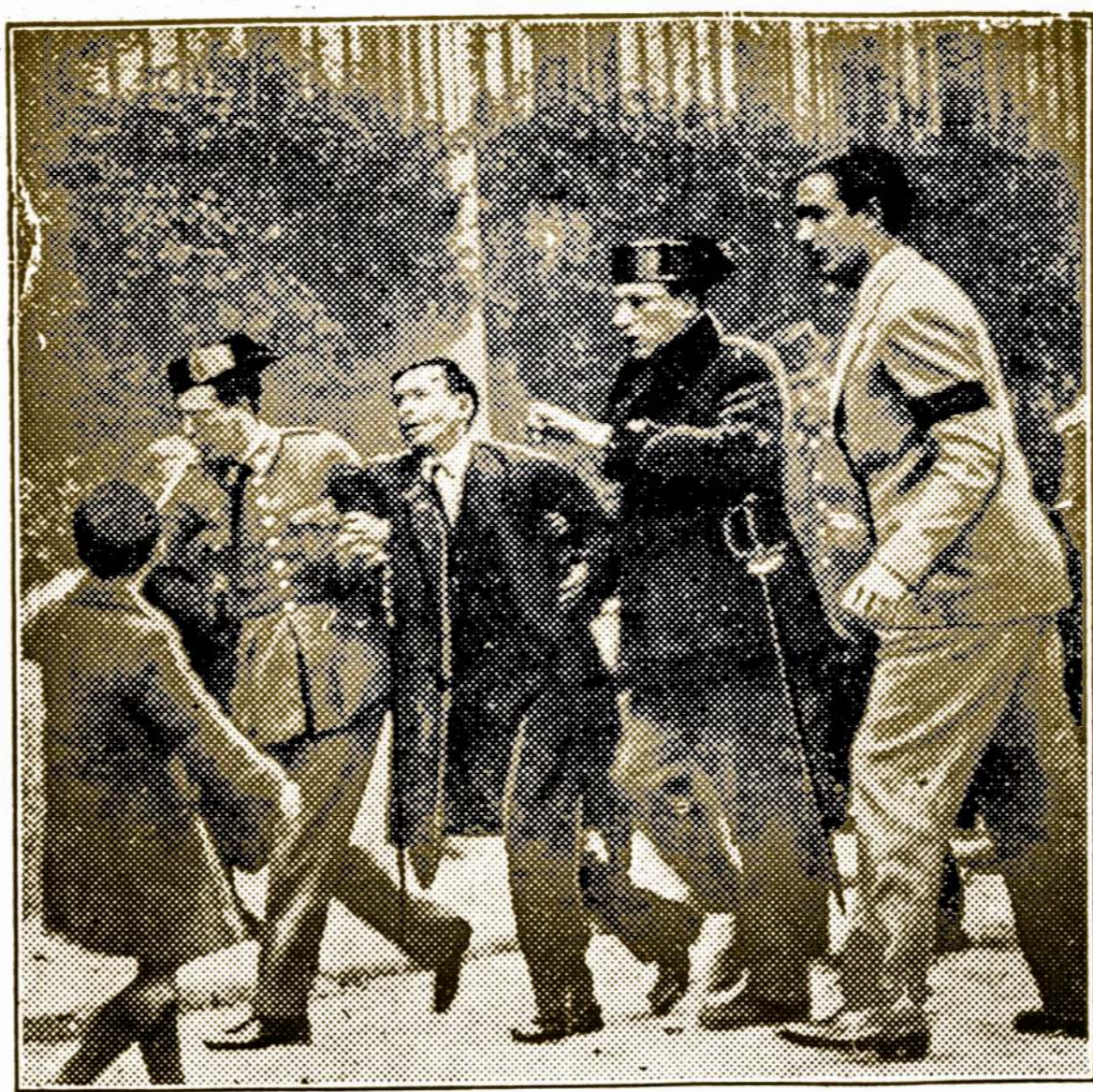
ISPANŲ KOMUNISTAI ŠOVĖ Į LAIDOTUVIŲ PROCESIJA Trys jauni fašistai buvo užmušti ir daug sužeistų Madridė, kada komunistai suėję ir nužimtą namą emė šaudyti į Civilio Sargų laidotuvių procesijos dalyvius.

SKAITYKITE ir PLATINKITE AMERIKOS LIETUVI