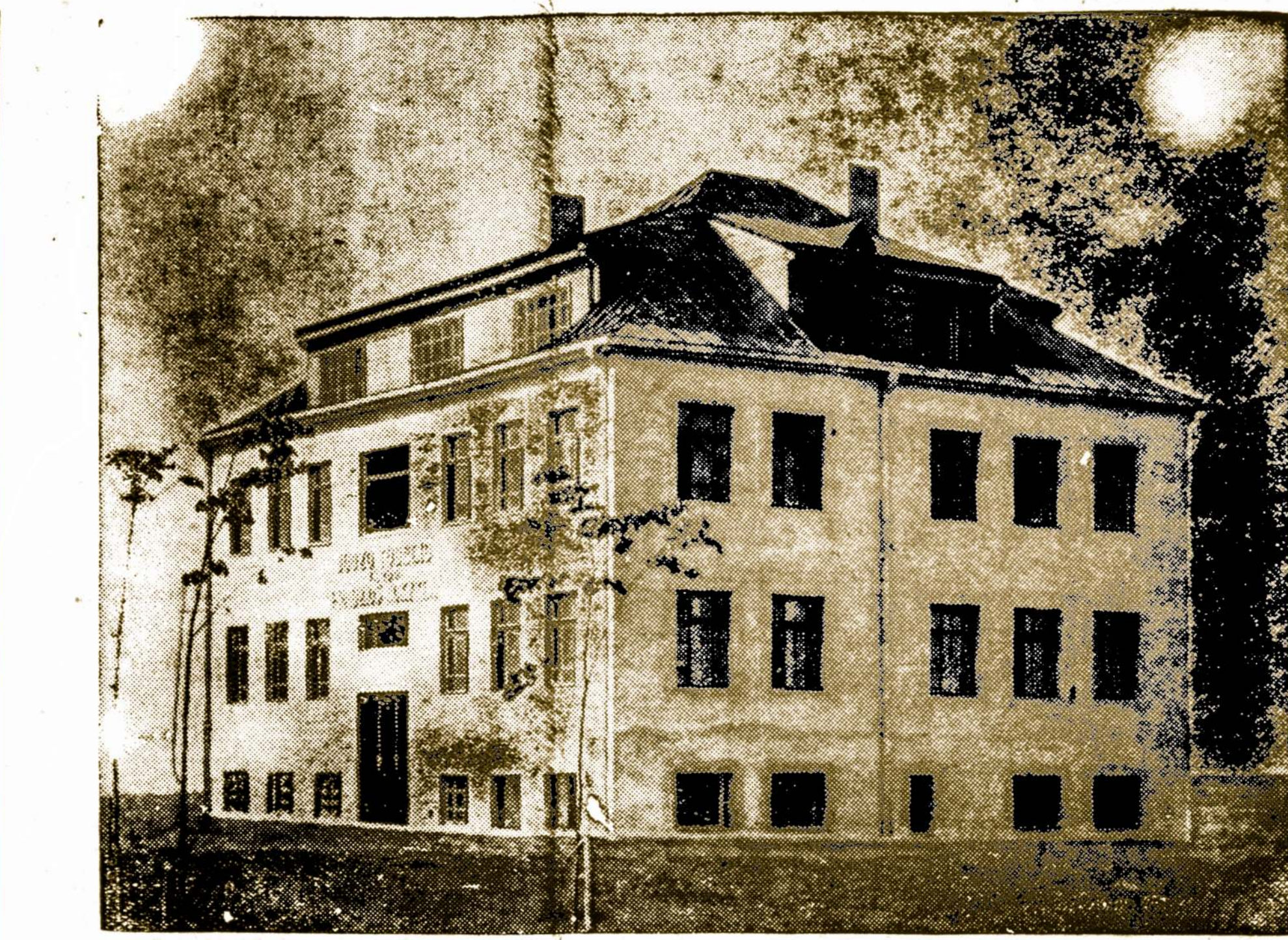
Ministerio pirmininko Juozo Tubelio vardu pradžios mokykla jo gimtajame krašte — Rokiškyje

Sekančiame mėnesy 15-tą ir 16-tą dieną įvyksta Tautų Lygos posėdis, kuriame iš naujo bus pakeltas Italų-Etiopų Afrikos karo klausimas. Tas Tautų Lygos posėdis bus svarbus, todėl, kad jame dalyvaus naujai išrinkti Prancuzijos atstovai, arba kitaip sakant, bus pareikšta opinija naujosios Prancuzų valdžios link italų-etio-pų karo užbaigimo Afrikoje. Tuo tarpu anglai su italais pradėjo švelnyt savo kivičius Afrikoje. Anglai veda pasitarimus su Rusija laivyno reikale. Rusija reikalau-