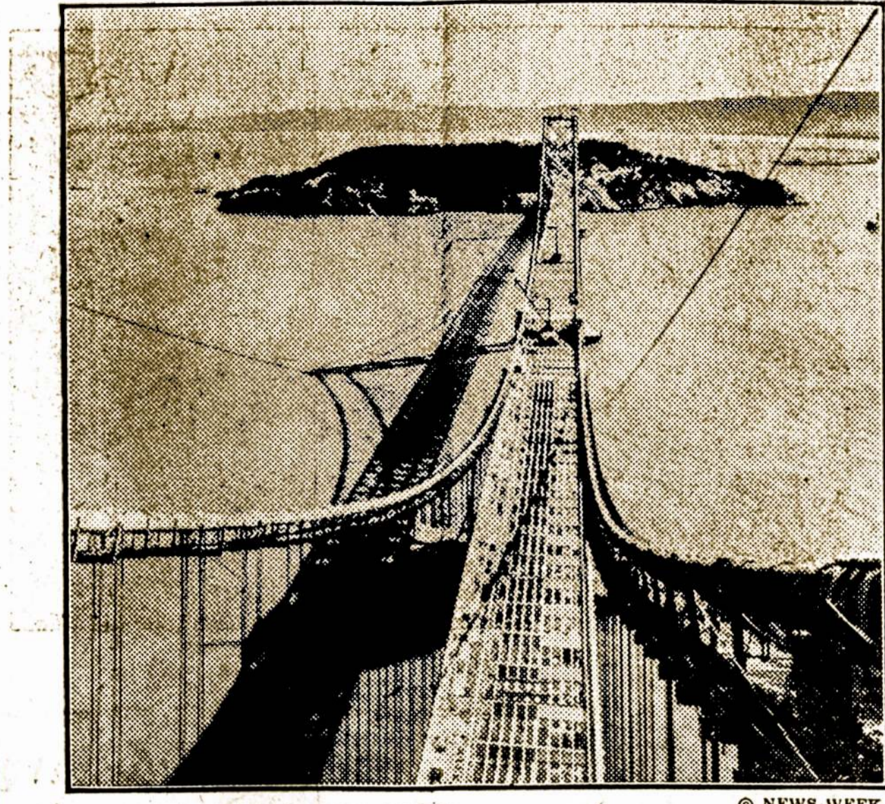
NAUJAS TILTAS SAN FRANCISCO IĻANKOJE

Kitas Metropolisio, dešinysal dienraštis, kurie žymiai artimesnis republikonams negu demo-