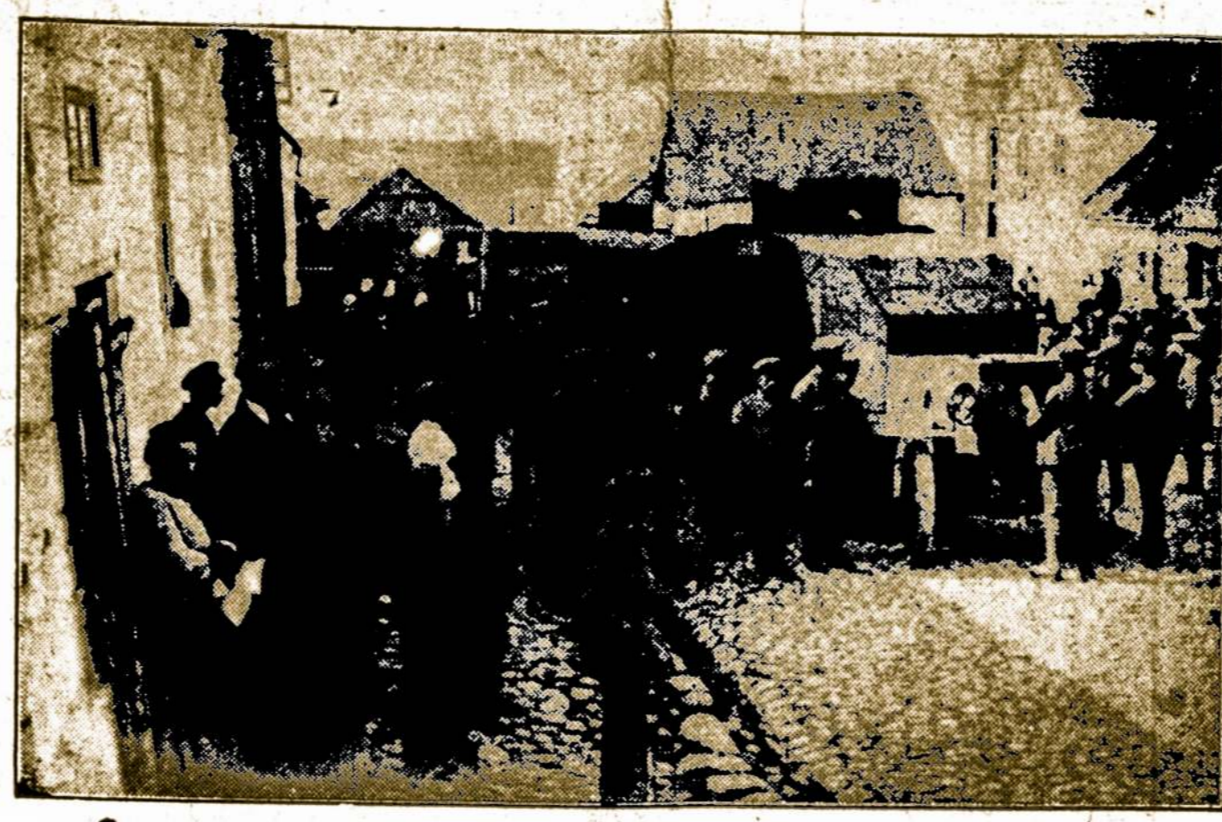
Lietuviai rengiasi kovon su lenkais

Mano patyrimai, vargas ir kentėjimai karo laikais, stumė mane į tautinę kariuomenę. Visi savanoriai buvo pasiryžę gyvybę aukauti už nepriklausomybę. Tiesa, lenkai buvo mažiausia 15 kartų galingesni už mus, jie gaudavo francuzų ir anglų pagalbą, juos rėmė ir kitų šalių