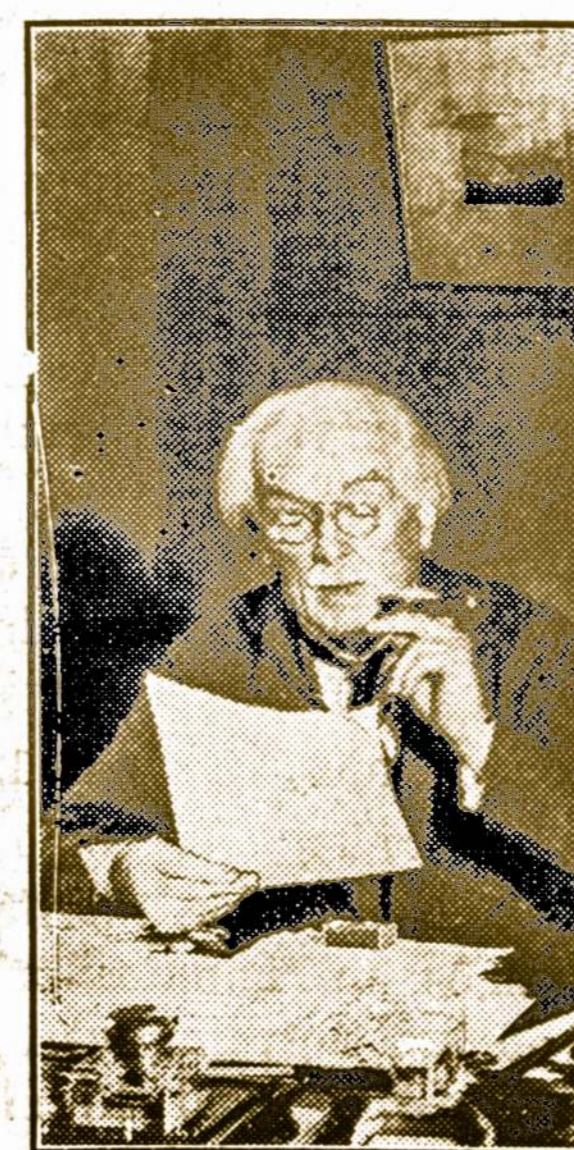
“ZIURKĖS”, SAKO LLOYD GEORGE