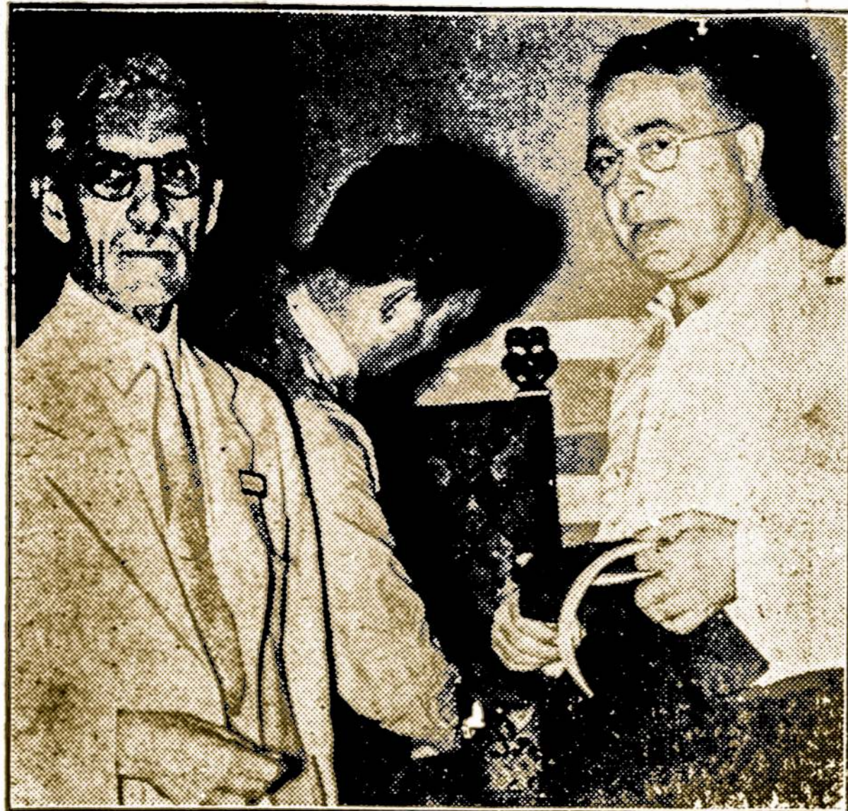
DR. TOWNSEND GAVO DVASIŠKIO PARAMĄ

Kairioji pusėje stovi Dr. Francis Townsend, seno amžiaus pensijų plano vykdytojas. Dešinėje pusėje stovi kun. Charles E. Coughlin, Detroito kariauninkas "radijo kunigas", kuris Clevelando townsendistų suvažiavime Suv. Valstijų prezidentą Ruzveltą išvadino "melagium" ir "didžiausiu išdaviku", ir užtai gavo gausių aplo-dismentų.