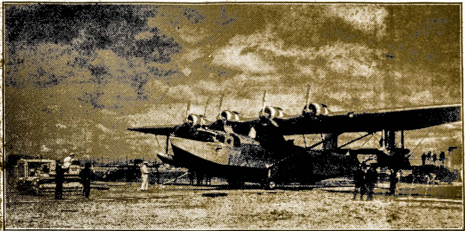
ORLAVIS PASIRUOŠES PIRMA SKRIDIMUI SU PASAZIERAIS