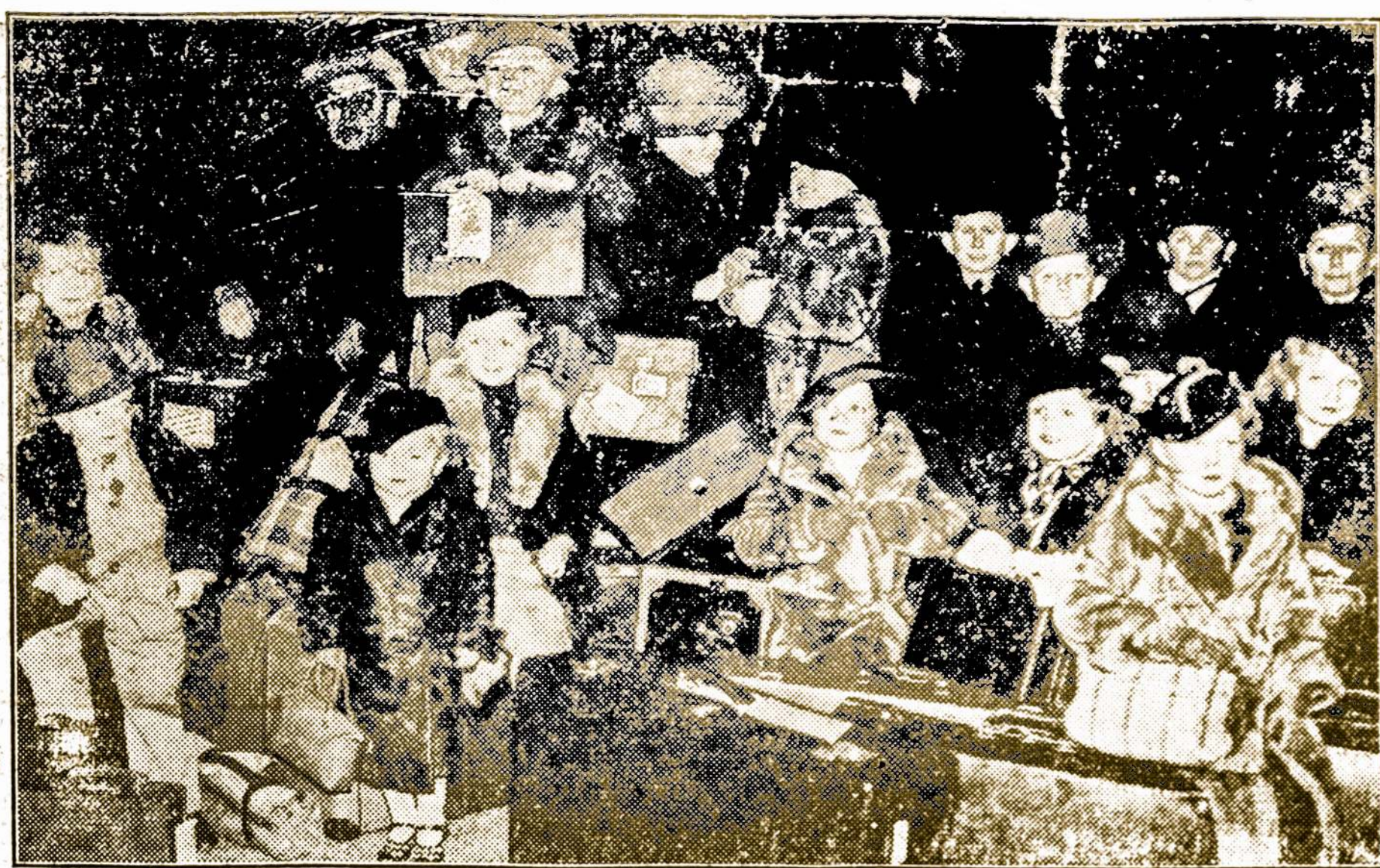
DEVYNIOLIKA MAŽIAUSIŲ ŽMONIŲ PASAULYJE Iš Budapešto, Vengrijos atvyko mažų žmonių į Londoną. Čia jie sustoje Victoria stotyje. Visi yra suaugę, keleta porų vedusių. Jie važinėja su savo vadevilius akta