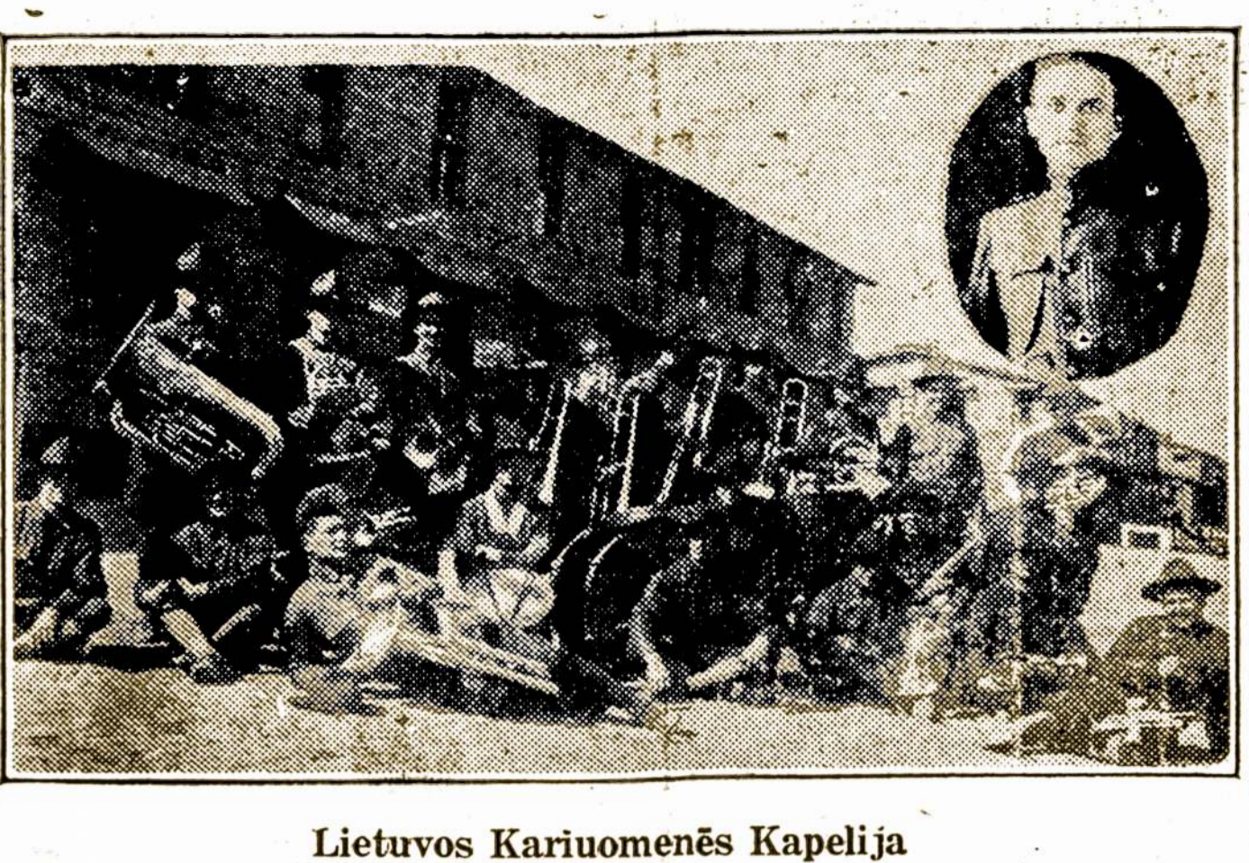
Lietuvos Kariuomenės Kapelija