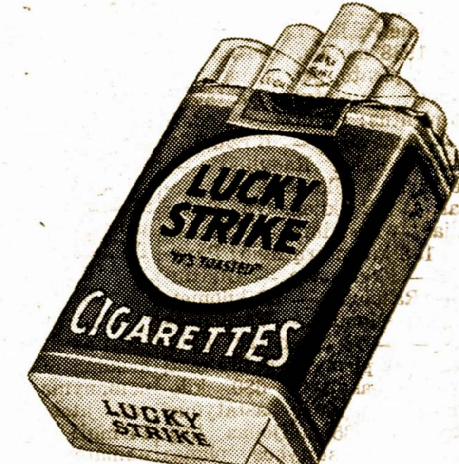
PUIKIAUSIAS TABAKAS — "DERLIAUS GRIETINĖ"