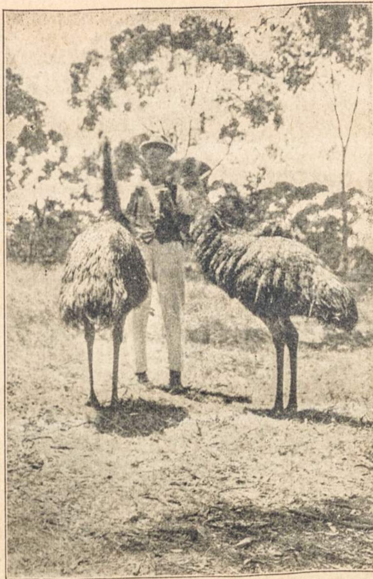
Australijos dykumų paukščiai Emu