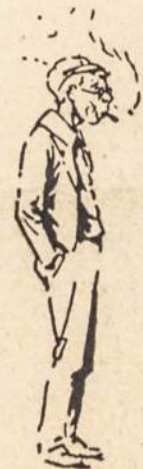
"Ištizi." Berniukas, kuris bezdžionuoja vyrą rūkydamas; Jis bus amžinas netikša.

Rūkantieji LSS nariai nerūko: skautų sueigose, iškylose, užsiėmimuose ir panašiai, dalyvaudami su kitais, ypač jaunesniaisiais, LSS nariai, būdami uniformuoti viešose vietose bei kitais atvejais dalyvaudami skautų ar skaučių vardu. Reiktų ir išemigravusiems mūsų broliams ir sesėms šių Pirmijos nuostatų ir gerų principų laikytis. Ar šiuo klausimu palaidumas neįsigali? Griežčiau kontroliuokime savo veiksmus ir atsi- (Perkelta į 14 psl.)