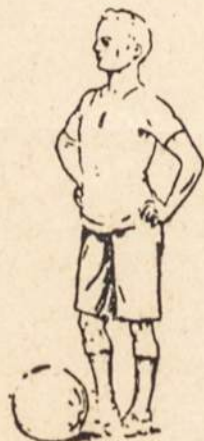
Stiprus ir sveikas berniukas laiko prie kojų sviedinį.

Rūkymo paprotys nesvetimas ir skautiškoje šeimoje. Kai kurie ir skautų vadai net perdėtai rūko ir rūkymui pridūoda tam tikros reikšmės, manydami tuo pakelsią savo "autoritetą." O savo silpnybei pateisinti tvirtina, kad ir skautybės kūrėjas Baden Powellis rūkęs ir nedraudęs skautams rūkyti.