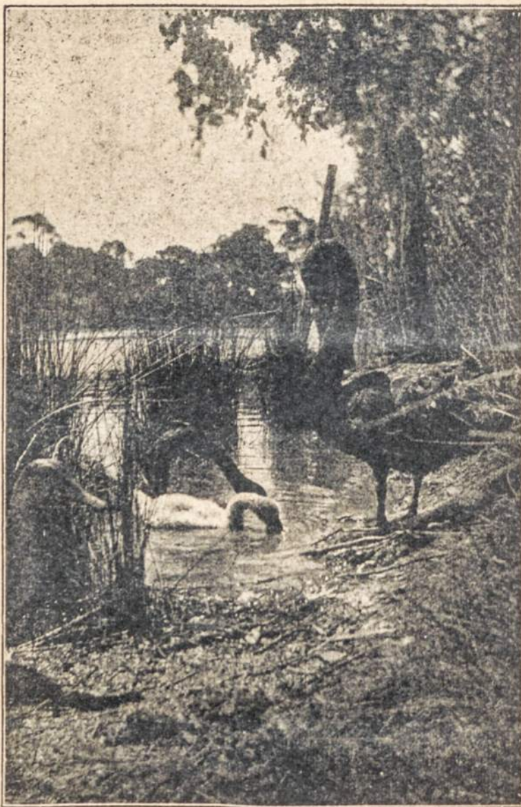
Gulbės Melbourno botanikos sode

"Old Australians" did not bring sufficient social pressure to bear on them.