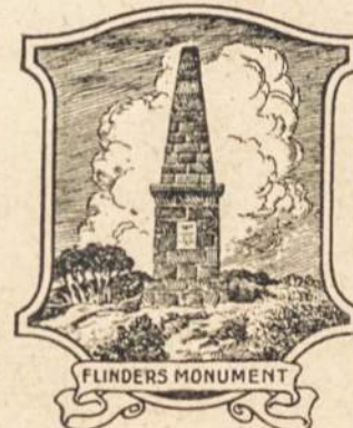
FLINDERS MONUMENT Port Lincoln, S. A.

However the musical life reached its peak in Li-