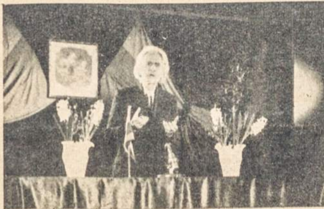
Lietuvių Tautos Pranašas Dr. Vydūnas Vasario 16 Gimnazijos atidarymo iškilnėse kalba į jaunuomenę.

kitą stengėsi prisidėti prie Elės kalbos.