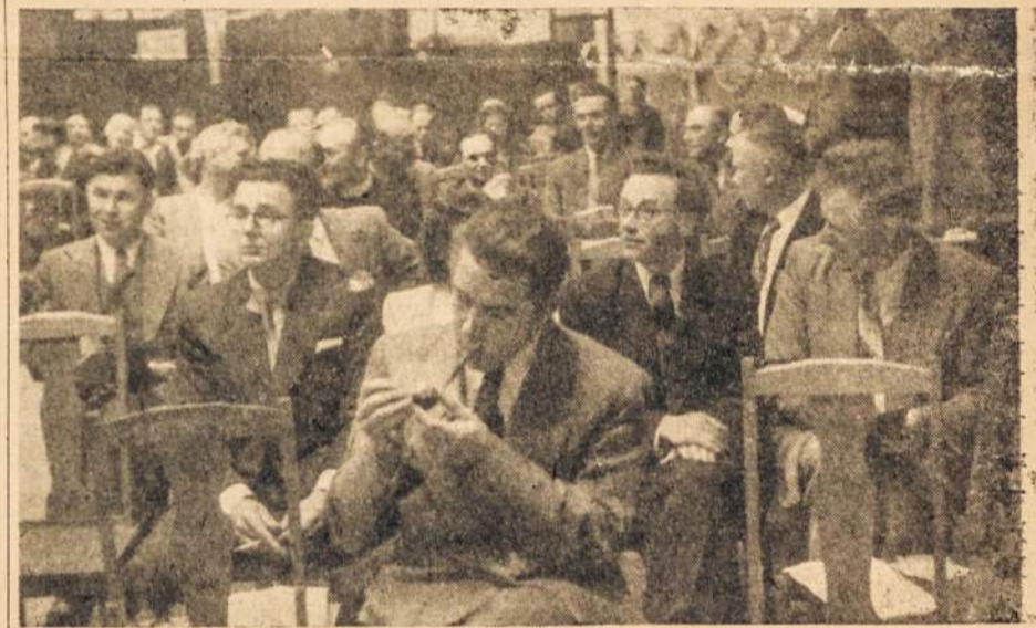
... kas dūmą traukė, kas pažįstamų veidų dairės ...

Po pirmininko pranešimo vėl iški-lo "Mūsų Pastogės" juridinės priklaušomybės klasimas, bet kadangi čia kiekvienas atstovas turėjo savo skirtingą nuomonę ir nieko konkre-