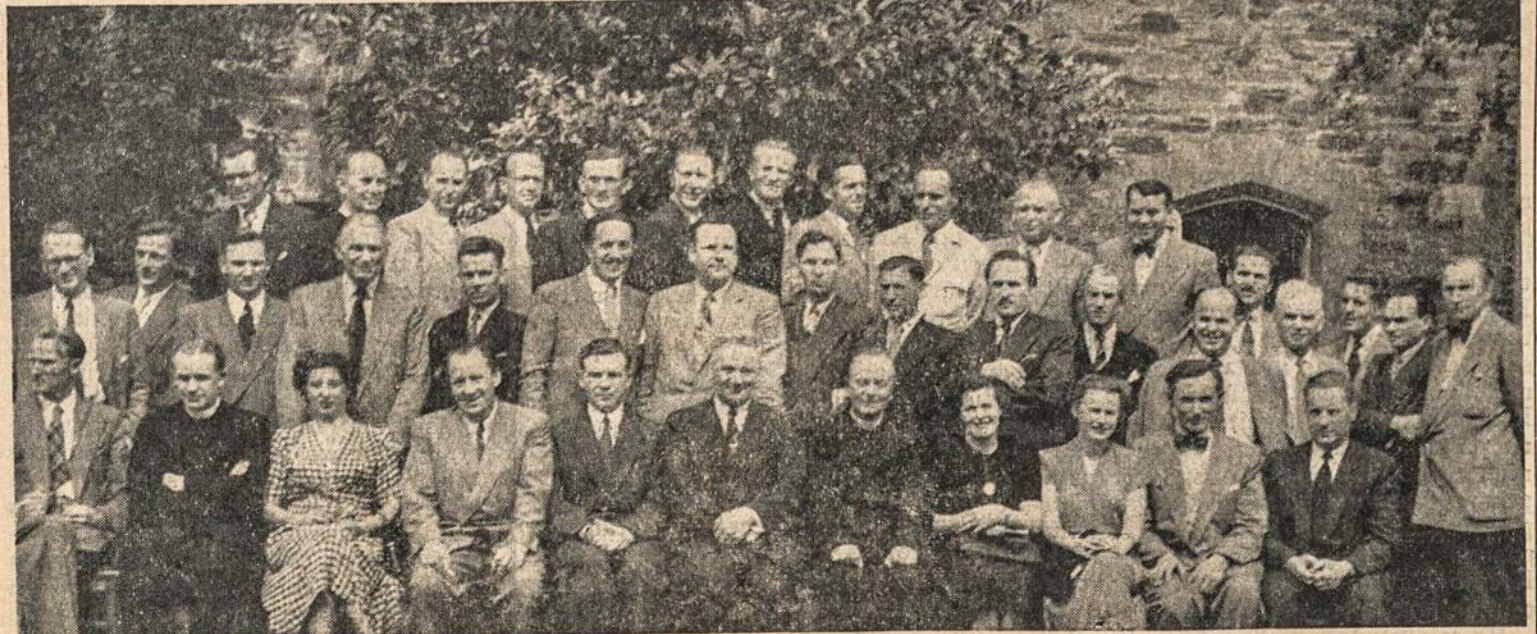
Australijos Lietuvių Bendruomenės Krašto Tarybos suvažiavimo dalyviai.

GERB. MUSŲ SKAITYTOJUS, kurie dar nepratęsete AL pranešimus šioms metams, prašome tai padaryti, kad nesustrukdytų laikraščio siuntinėjimas. AL Leidykla