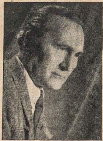
Rež. J. Gučius

(Adelaidės Lietuvių Teatro spektaklis suvažiavimo proga).