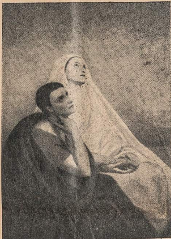
Motina šv. Monika su savo sūnum šv. Augustinu.

nos, kitos vaiko pastebėtos ir tik jam vienam reikšmingos smulkmėnos. Ir, štai, įvyksta lūžis, kuris jo ateityje turės milžiniškos reikšmės. Šeimoje įsigyti religingumo pagrindai dažnai būna stipresni ir daugiau paremti pačiu tikėjimu, negu protu ir išskaičiavimais. Jie būna stipresni už vėliau įsigytus studijomis. Todėl kiekviena motina turi išsiamoninti ir vien dėl vaiko turi pati religingume atgimti, kad galėtų būti savo augančiam vaikui religijos mokytoja ne tik žodžiais, bet ir kilniu pavyzdžiu. Prie to taip pat turi prisidėti ir tėvas, nes jeigu motina moko vienai, o tėvas kitaip, negalima norėti, kad vaikas ko nors išmokyti.