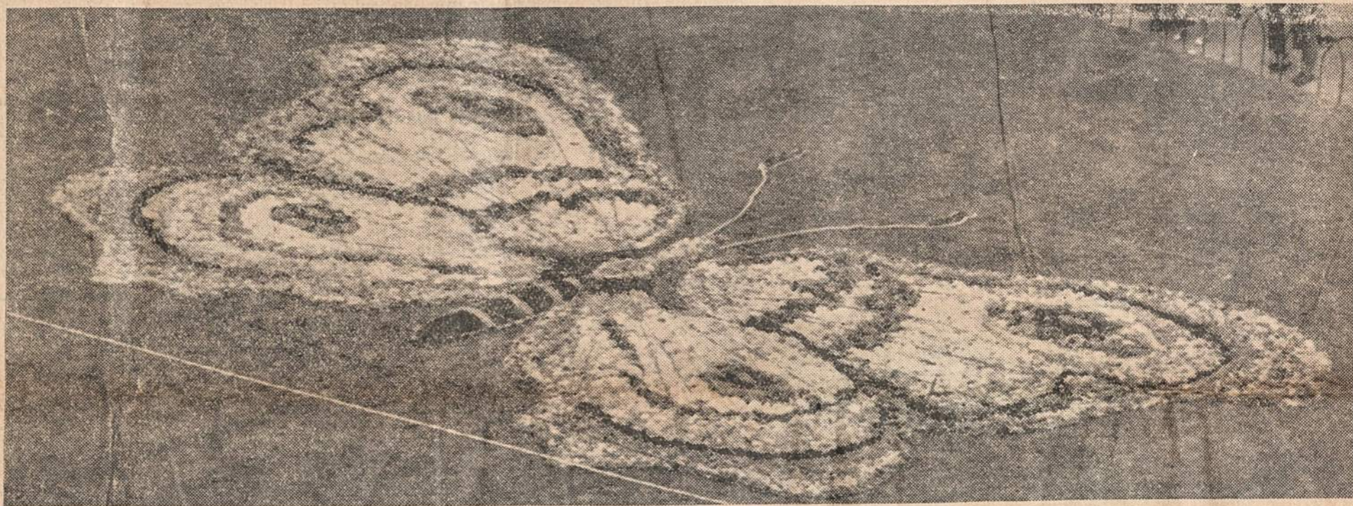
FLOWER DAY in Adelaide. — The picture above shows a 44 ft. long butterfly. It took 100,000 blooms.

"But you know, a criminal always returns to the scene of his crime."