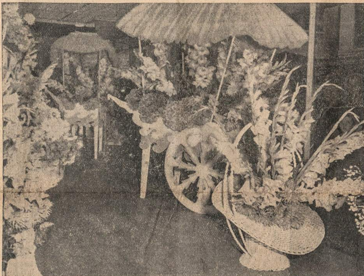
FLOWER DAY in Adelaide. — This attractive window display was a center of interest for large crowds. It took first prize in the formal section.

— ALTO delegacija, be prezidento Eisenhowerio, Lietuvos bylos reikais lankėsi dar valstybės departamente ir susisiekė su atskirais senatoriais. Paskum jai Lietuvos pasiuntinybėje buvo suruoštas priėmimas, ALTO vadovybė yra numaciusi kviešti talkon visas lietuvių organizacijas, draugijų veikėjus, senuosius amerikiečius ir naujai atvykusius tremtinius.