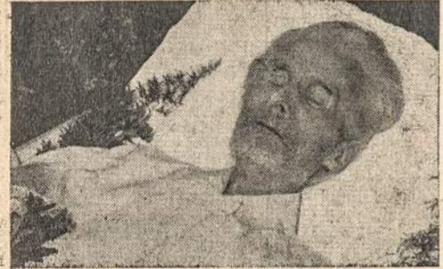
Dr. Vydūnas pašarvotas baltais rūbais.

* Balandžio mėn. New York'e įvyko Sambūrio "Šviesa" septynerių metų egzistavimo minėjimas.