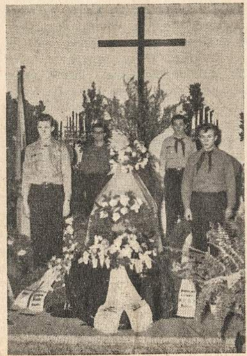
Skautai neša garbės sargybą

Už jo bičiuliškumą Brolijos Vadiją, 80 metų sukakties proga, suruošia iškilmingą akademią, kurioje Velionis asmeniškai pats dalyvavo. Daug skautų vienetų pasveikino savo garbingąjį Bičiulį. Studentai skautai jį išsirinko Garbės nariu ir suteikė savo korporcijos spalvas Pabaltijo Universitete Pinneberge. Kai šiais metais vasario 26 d. jį laidojo, Detmolde, didelis būrys skautų iš "Aušros" Tunto dalyvavo jo laidojimo. Prie karsto skautai nešė garbės