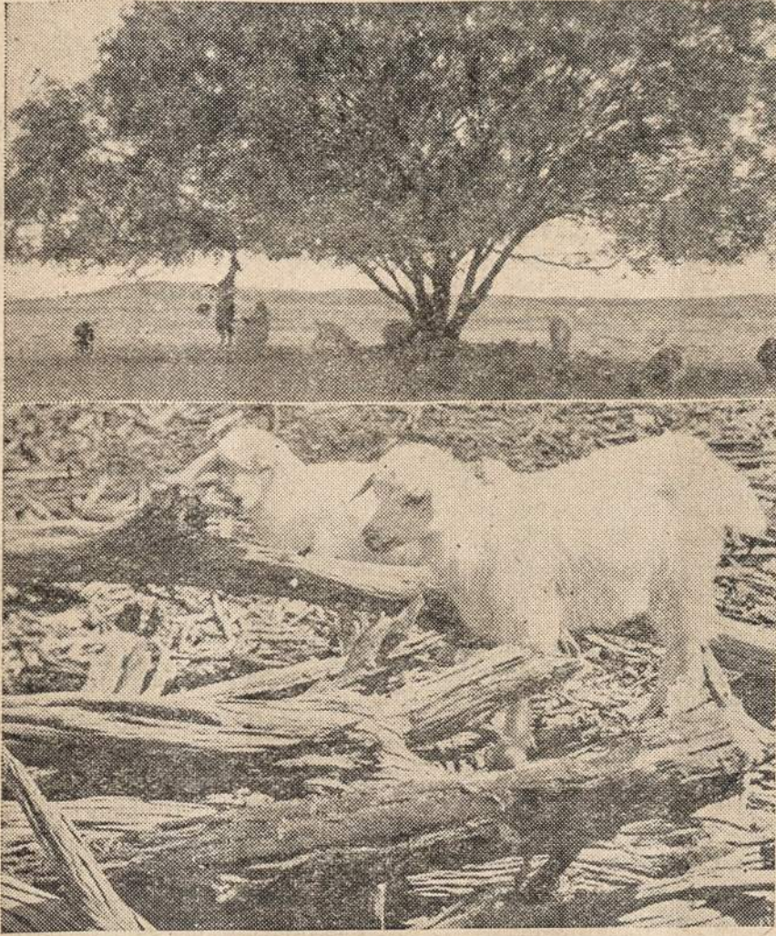
Ožkos Šiaurės Teritorijoje sausrų metu raško lapus nuo medžių.