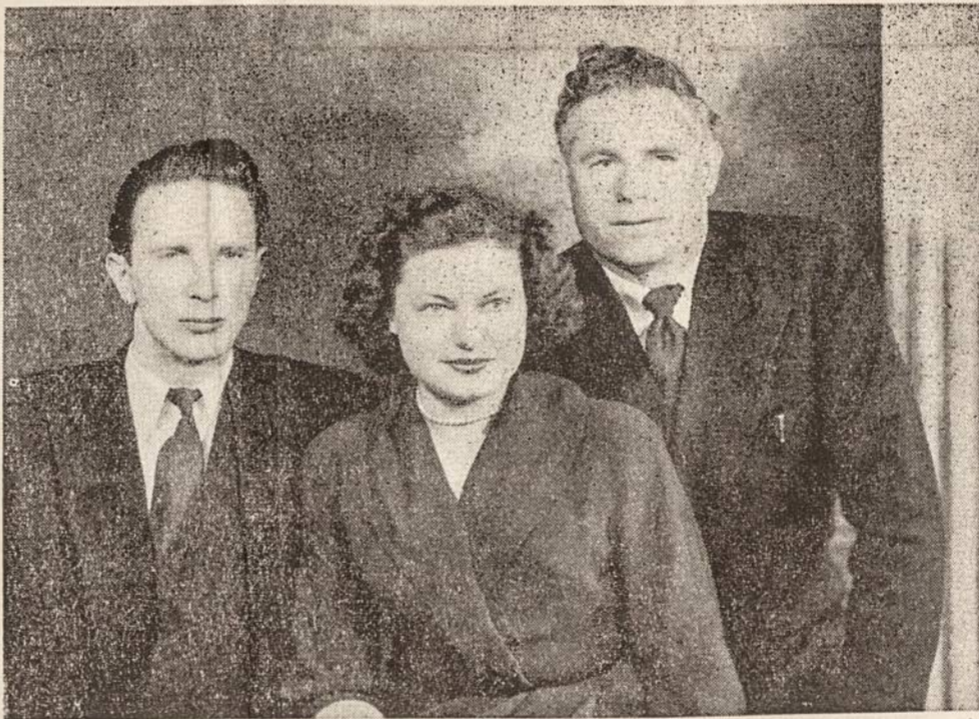
Dabartinis "Australijos Lietuvis" Leidyklos techniškas personalas (iš kairės į dešinę):

Baigiant šią trumpą apžvalgą dar tektų sustoti pora žodžių dėl mūsų atstovaujamos politinės orientacijos. Esame keletą kartų pabrėžę, kad laikomės plačiai suprantamos tolerancijos ir demokratinio principų. Tai sakome ne tik žodžiais, bet vykdomė darbu. Mūsų giliausiu įsitikinimu, tik demokratinės idėjos yra pačios moderniausias, garantuojančios kiekvienam žmogui pilnutinę kūrybinę ir asmens laisvę. Štai dėl ko mes nepalaikome jokių diktatūrinių puoselėjimų. Esame įsitikinę, kad būsimoji laisva Lietuva taip pat tvarkysis demokratiniais principais, o šiuo metu, kartu su mūsų skaitytojų mase, mes palaikome ir remiame visas mūsų demokratinės institucijas, kaip VLIKą, Amerikos Lietuvių Tarybą ir kitas, kurios veda aktingą kovą už Lietuvos išlaisvinimą ir demokratinio principų ten atsitymą. Mūsų tai laikraestyje randa vietos visi, pradedant katalikais ir baigiant socialdemokratais, kas tik neatsiriboja nuo šių principų.