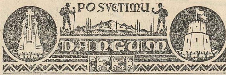
Redaguoja psktn. Alb. Pocius