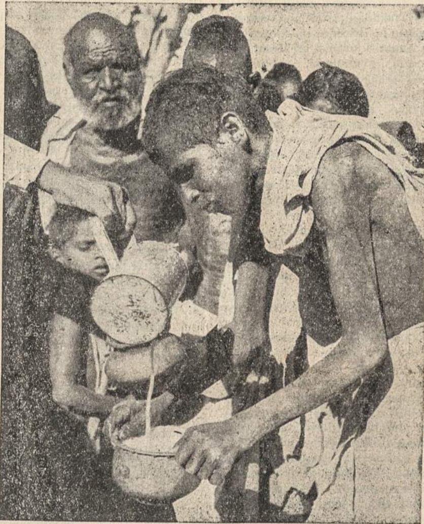
Raudonasis Kryžius dalina maistą bado paliestųjų sričių gyventojams Indijoje.