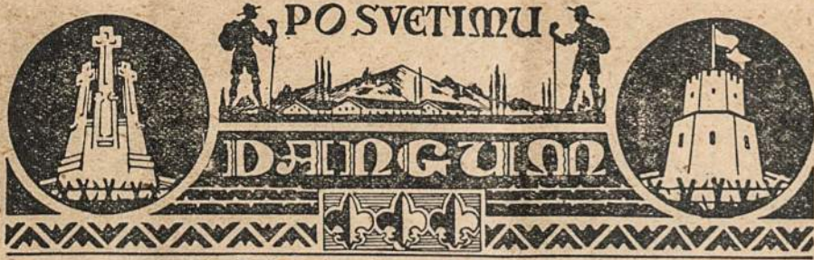
Redaguoja psktn. Alb. Pocius