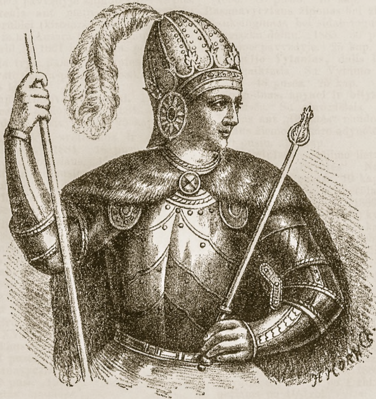
VYTAUTAS, DIDYSIS LIETUVOS KUNIGAIKSZTIS. 1391—1430.