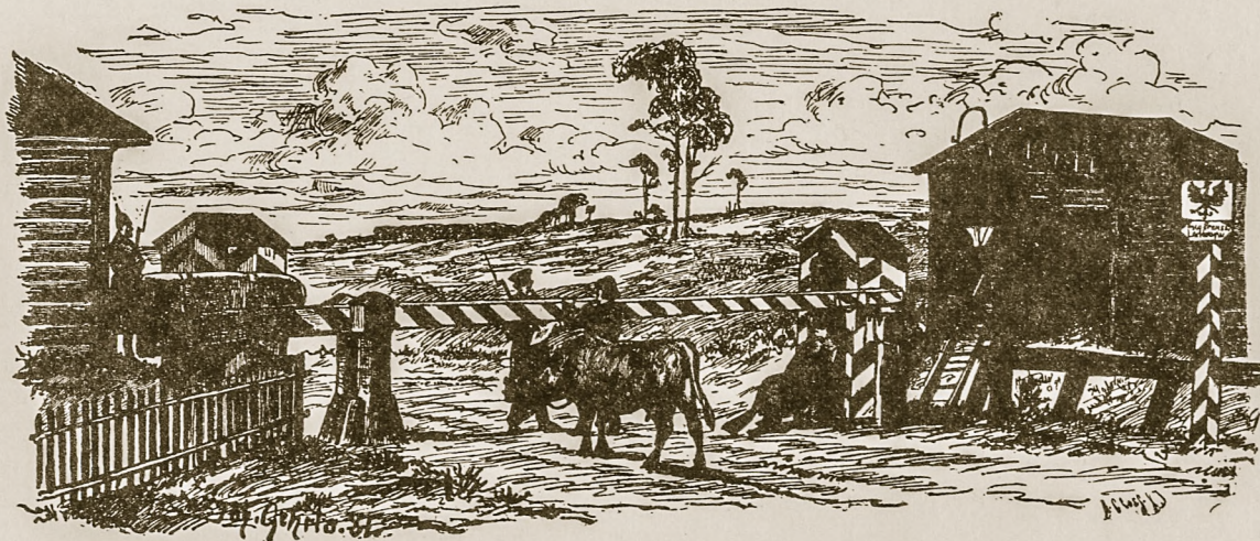
Maskolizkasis rubežius. (Apraszymas ant l. 160).