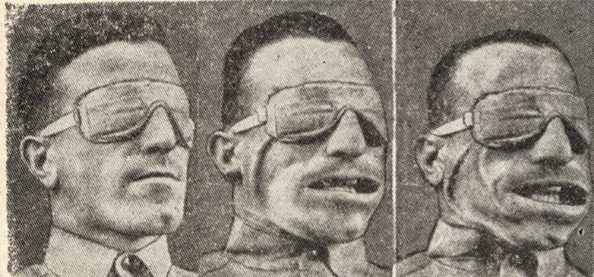
Taip keičiasi žmogaus veidas greitėjimo jėgai veikiant.

Penicilinas šiandien yra vardas, kurį kartoja visa žmonija. Praėjusio karo metu jis išgelbėjo beveik pusę sužeistųjų nuo mirties. Atstrasas jis buvo paprastu supuolimu: britų gydytojas Flemingas, atostogaudamas Šveicarijoje, pastebėjo, kad ganyklose yra apvalios vietos, kurios skiriasi nuo visos ganyklos. Jos atrodė tarsi būtų skriestuvu specialiai išbrėžtos. Tyrinėdamas pastebėjo, kad tai yra todėl, kad tos vietose neauga kaikiurie augalai. Niekas negalėjo išaiškinti (nukelta į psl. 6)