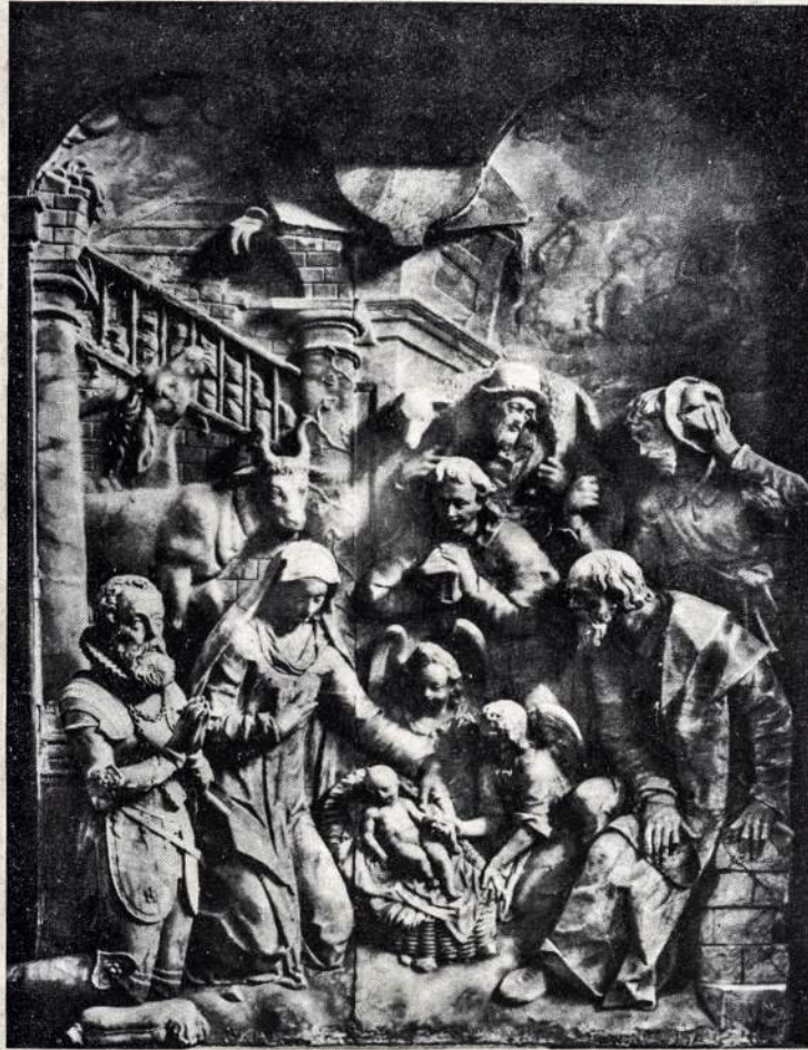
Kalédinis altorius Bonos miunsteryje