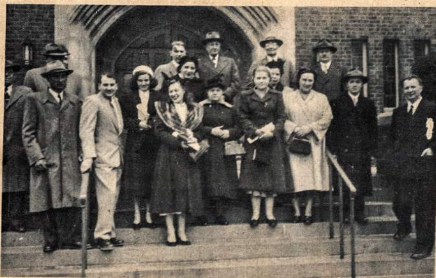
Pirmos lietuvių liuteronų pamaldos Clevelande, 1954 m. kovo mėn. 28 d.