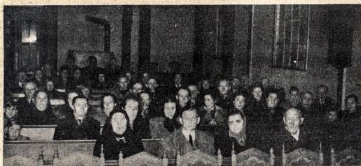
Lietuvių pamaldos Kiel-Friedrichsort