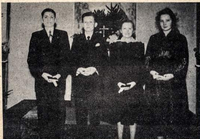
Konfirmandai Diepholze 1954 metais