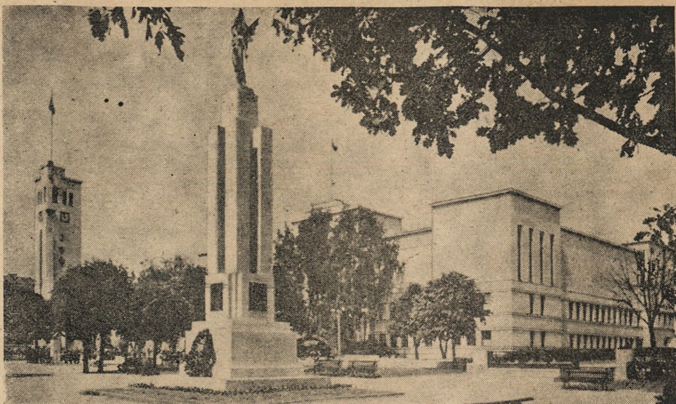
Lietuvių laisvės ir tautos kultūros šventovė — Karo muziejus su Laisvės statula, su varpinės bokštu, iš kur anais laisvės dienomis skambėdavo Laisvės varpas, su muziejaus sodeliu, kur prie Nežinomojo Kareivio kapo pagaliai nulenkavo galvą lietuviai, o jo lūpos tardavo giesmės žodžius, kur džiaugsmo ir liūdesio dienomis minčių minios rinkdavosi... O šiandien...