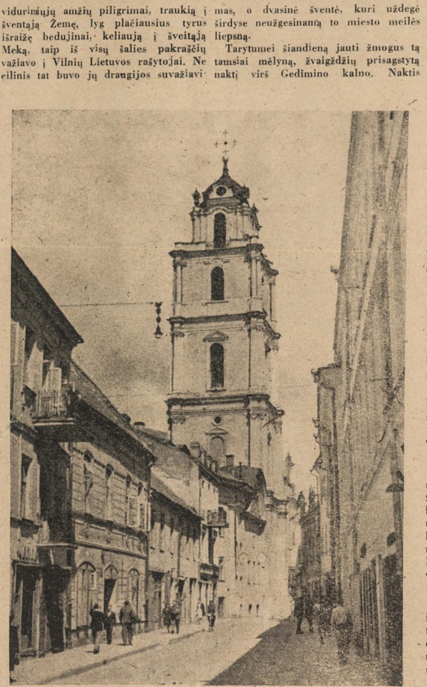
Švento Jono gatvė Vilniuje ir gražioji Sv. Jono varpinė.

Pirmasis nepriklausomos Lietuvos rašytojų draugijos suvažiavimas ne laikinojo, bet amžinojojo sostinėje. Lyg