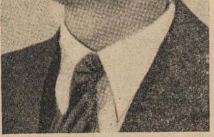
Trečiasis Lietuvos Respublikos Prezidentas Dr. Kazys Grinius.

Reziumuodamas pareiškė mintis, susirinkimo vedėjas, Čikagos universiteto tarpautinės teisės profesorius, pareiškė, kad tarpautinės teisės atžvilgiu visos suvereninės valstybės, didelės ar mažos, yra lygios: visos tur tas pačias teises ir pareigas; Pabaltijo valstybių byla gali būti iškelta JT konferencijoje.“