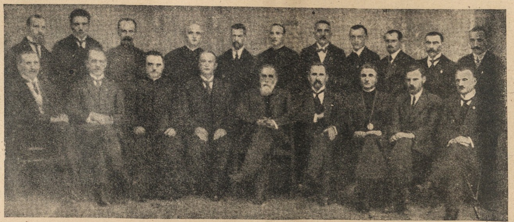
Lietuvos Taryba 1918 m. vasario 16 dieną paskelbusi Lietuvos nepriklausomybę. Iš kairės dešinėn Ije eilėje sėdi: J. Vileičius, dr. J. Saulys, kun. J. Staugaitis, S. Narutavičius, dr. J. Basanavičius, A. Smetona, kun. K. Šaulys, inž. St. Kairys, A. Petrusis; IIje eilėje stovi K. Bizauskas, J. Vailokaitis, D. Malinauskas, kun. V. Mironas, M. Biržiška, kun. S. Smilgevičius, S. Banaitis, P. Klimas, A. Stulginskis, J. Šernas ir Pr. Dovydaitis. Šeši iš jų išvežti į Sibirą.

„Daily News“ primena, kad Amerikos vyriausybė pasmerkė Baltijos šalyse rusų praveistus rinkimus, nepripažino jų kraštų prijungimo prie Rusijos ir tebelabai jų atstovybes Washingtone, lygiai kaip tai daro ir kai kurie kiti kraštai. Tik Argentina, suėjus į santykius su Rusija, suspendavo Baltijos kraštų atstovybes. Baltijos kraštai savo viltis buvo sudėję į Atlanto Carterį. Dabar jie tikisi, kad gal Maskvos konferencijoje iškilis jų laisvės byla. Jei tai neįvyktų, būtų mėginama Lietuvos ir kitų Baltijos kraštų laisvės reikalą iškelti Jungtinėse Tautose. „Daily News“ primena nesėkmingą prezidento Trumano pareiškimą, kad Amerikos politika Baltijos šalių atžvilgiu nesikeitė ir nesikeis. Taip pat nurodo respublikonų partijos pirmininko Reece pareiškimą prieš rinkimus, kad respublikonai stovi už tų šalių nepriklausomybės atstatymą. Po rinkimų daugiau nieko negirdėti iš abiejų partijų Baltijos kraštų laisvės reikalą. „Daily News“ iškelel šiuos klausimus, yra didžiausias Amerikos laikraštis, šio klausimo spausdinąs apie pusrėčio milijono, o sekmadieniais per 4 milijonus egzempliorių.