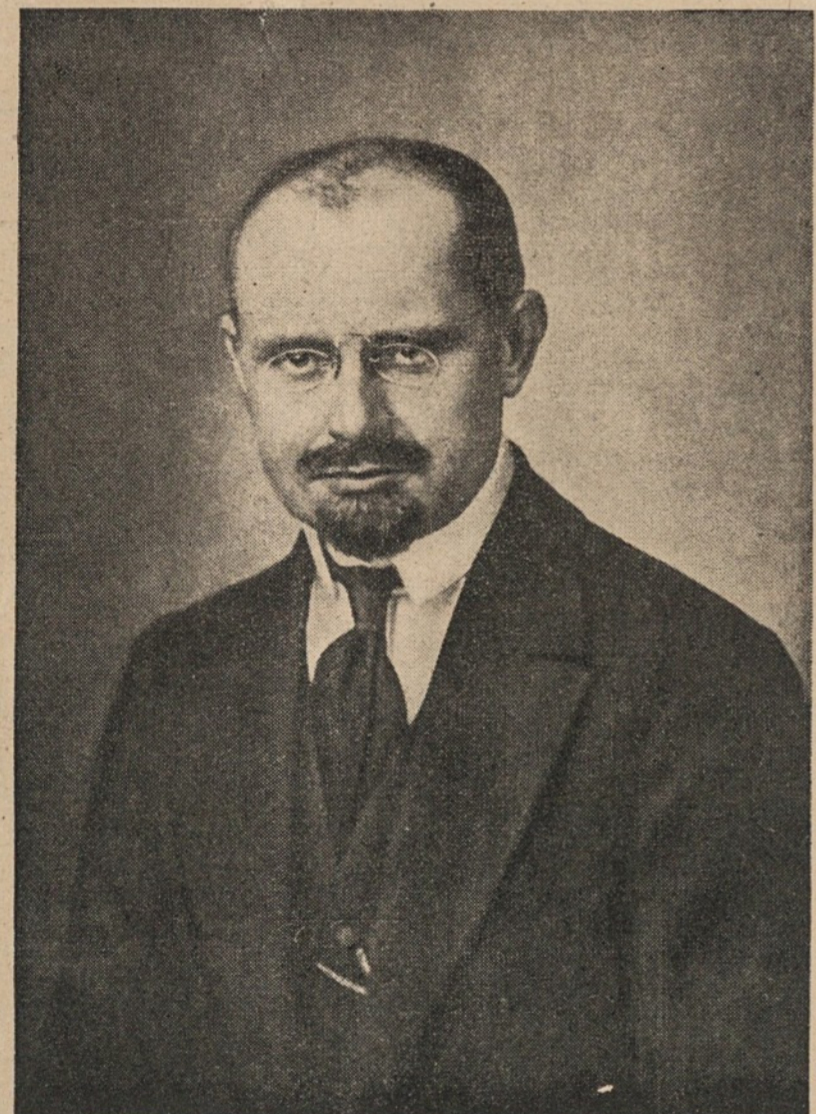
Antrasis Lietuvos Respublikos Prezidentas Aleksandras Stulginskis.