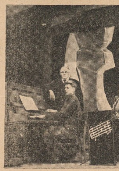
Kasselio lietuvių stovyklos jaunieji muzikantai

Bent po 20 dolerių kiekvienam Nors ir gerokai emigracinių darbų gulamas, BALF'as nepa- miršta ir tremtinių šalpos. Prieš Kalėdas į Europą jis pasiuntė de- vėtyliu drabužių 367 maišus ir avalynės, aprangos ir kit reikmenų 50 dėžių. Visa tai sveria 46.084 svarus ir yra verta 75.615,10 dolerių. Pats BALF'as apskai- čiavo, kad duodant visiems, kiek-