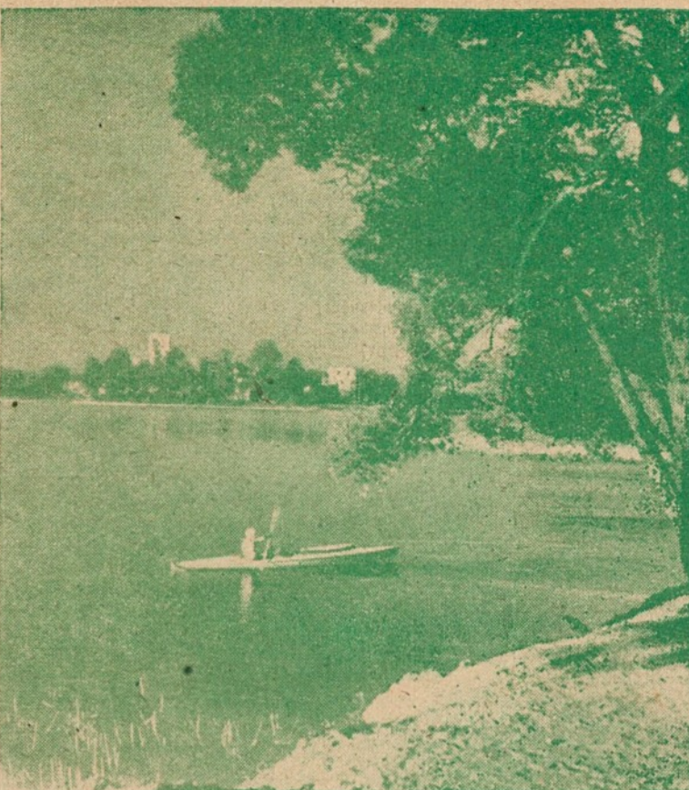
Pavasaris Trakų ežere

PER 19 MIN. — 132.000 DM London, Empress Hall bokso