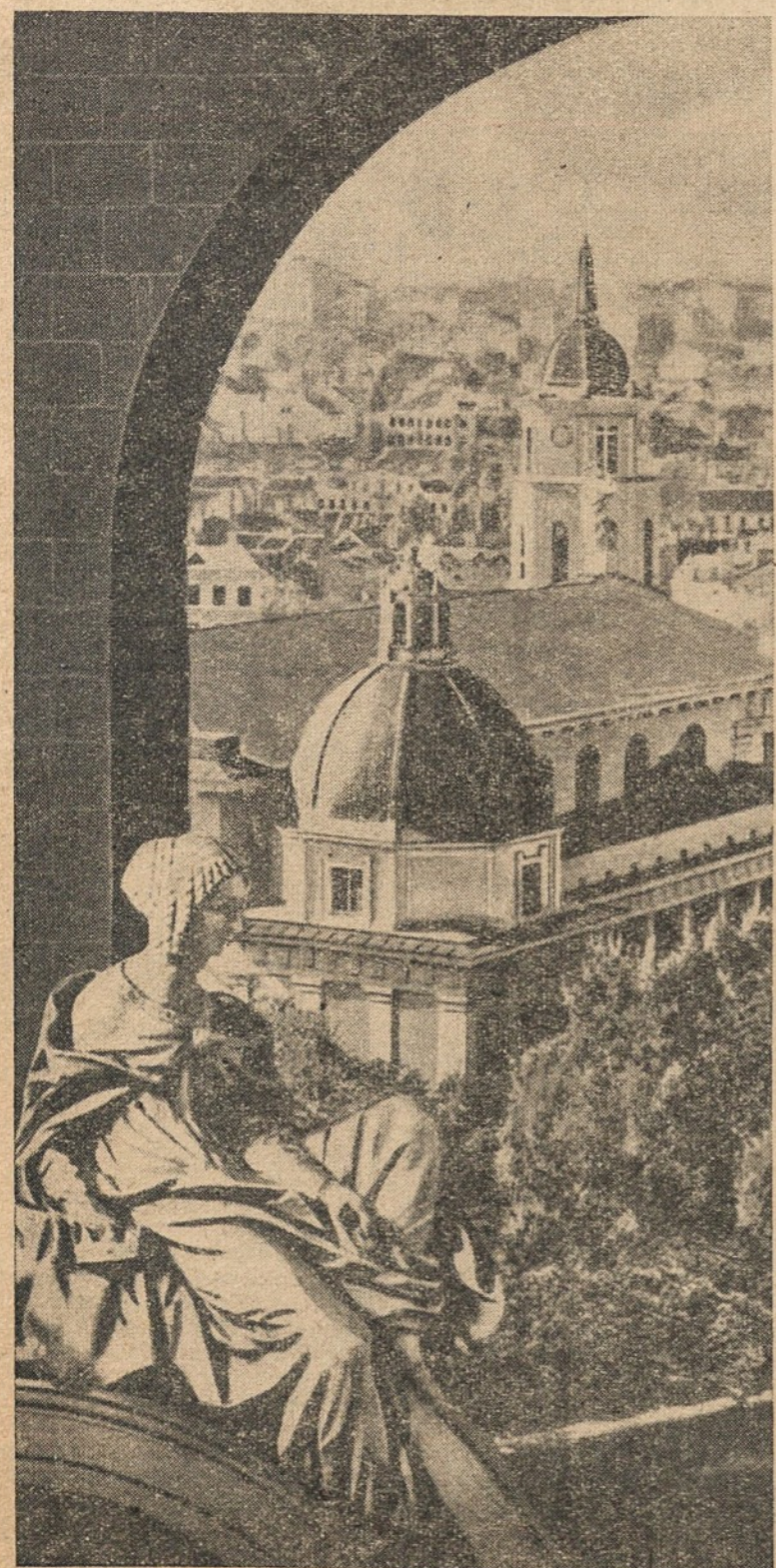
Priskėlimo šventėje dar ir šiais metais tyli Vilniaus šventovių varpai...

Po trumpų pasitarimų Haagoje Vakarų Unijos valstybių gynybos ministras baigiamine komunikate pranešė, kad jau yra visiškai susitarta dėl V. Europos gynybos ir tam yra parengti atitinkami planai.