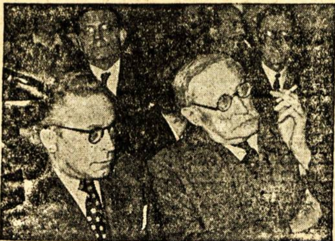
Prancūzijos socialistų partijos p-kas L. Blumas parlamente klausosi debatų laike vyriausybės krizės.

Ypatingu šios sesijos pasisekimu laikoma ta aplinkybė, kad visos penkos didžiosios valstybės balsavo už Palestinos tyrimo komisiją.