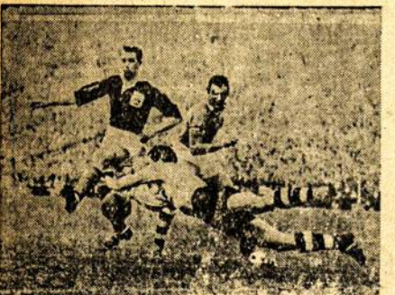
Rungtynių momentas tarp Anglijos ir Europos kontinento rinktinių

Kitas įdomus susitikimas buvo tarp Kur-sa ir ASK. Nors kai kurie akademikai prieš didžiaugius latvius atrodė kaip vaikai, ta-čiau šį kartą sukovojo daug geriau už Ko-vą. Visą žaidynių laiką prilaikydami 4—2 taškų skirtumu vistik išlyginti nepajėgė ir pralaimėjo tik 27:25.