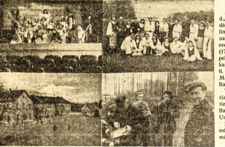
IS DILLINGENO LIETUVIŲ STOVYKLOS GYVENIMO. Mūsų atvaizduose viršuje (iš kairės) scena iš vaikų teatro vaid. „Miegantioji snieguolė“ ir tautinių šokių šokėjų grupė. Apačioje bendras stovyklos vaizdas ir miške dirbantieji vyrai pietauja.

Po šių varžybų Mintis turi po vieną lai-mėjimą ir pralaimėjimą, o tinklinyje 1 lai-mėjimą. Gz.