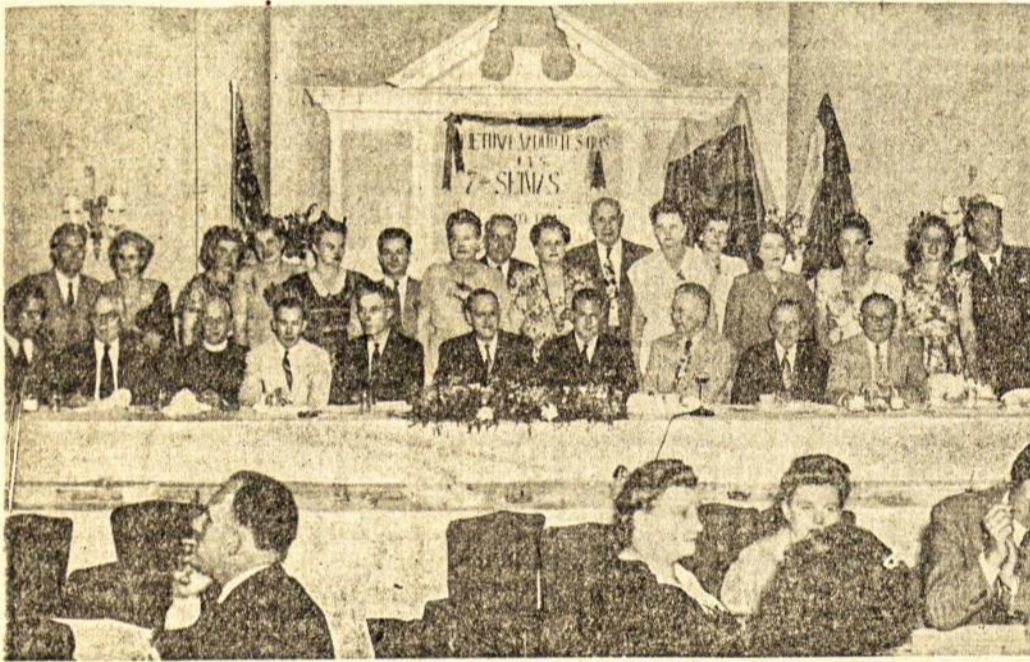
LIETUVAI VADUOTI SAJUNGOS 7-SIS SEIMAS WATERBURY, CONN.

Redakcija nesunaudotų rankraščių nesaugo * Honoraras:mokamas tik nuolatiniams bendradarbiams: iš anksto susitarus * Pirmamam skelbimai, tik iš anksto už juos apmokėjus * Skelbimai iki 10 petito eilučių RM. 20.—, toliau už kiekvieną eilutę po RM. 1,50. * Redakcijos ir administracijos kalbamoms valandos kasdien, išskyrus šventadienius 9—12 val. ir 14—17 val. * Red. ir administracijos telef. Nr. 2677.