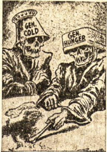
„DU DIDIEJI“ (gen. šaltis ir gen. badas) (iš N.Y.T.)

Trumpai visuose kraštuose lengvatlečiai darbuojasi turėdami prieš akis viliojantį tikslą — dalyvauti ir tinkamai pasirodyti Londono olimpiadoje. K. Cerkelūnas.