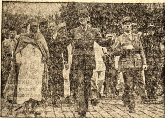
GEN. DE GAULLE ALZIRE Neseniai gen. de Gaulle Alzire pasakė didelę priešrinkiminę kalbą, kurioje jis atkreipė pasaulio dėmesį į Sovietų Sąjungos imperializmo pavojų. Čia matome gen. de Gaulle Alzire gatvėse. Jį lydi generolas Deschamps ir Alzire atstovai.

Ar dar už pusės metų sambūris apjungęs 60% prancūzų ir tuo būdu legaliai pėrimis šalies likimo vairą, priklausytų prae-