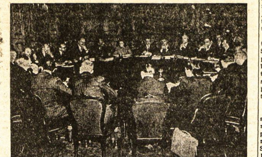
Užsienio reikalų ministerių pavaduotojai posėdžiauja Londone.

šimo procedūra. O sovietų pasiūlymas priešingai, pirmąjį numato Vokietijos taikos sutarties paruošimo svarstymą ir tik paskiausiuoju punktu sovietai siūlo svarstyti Austrijos sutarties klausimą. Britų pasiūlyma, kurį rėmė ir amerikiečių atstovas, kad Pakistanui būtų leista dalyvauti prie taikos sutarčių paruošimo, sovietų atstovas reikalavo atidėti. Tolimesnį pasitarimų eigoje amerikiečių atstovas atsiėmė savo prieštaravimą prieš tai, kad taikos sutartis turi būti ratifikuota vokiečių vyriausybės. Amerikiečiai pirmiau laikėsi to nusistatymo, kad taikos sutartim atsakomybė turėtų būti uždėta visai vokiečių tautai.