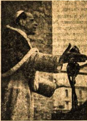
Sv. Tėvas Pijus XII gina nuskriaustą tautą reikalus.