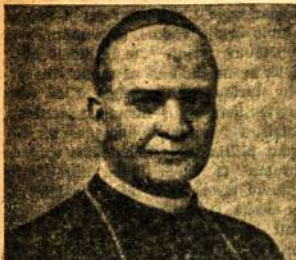
Arkivyskupas J. Matulevičius

Giliu pagarbos jausmu lydime mūsų Tautos vadus, kovojančius prieš žiauriausią priespaudą Tėvynėje, tremtyje ir visam pasauli. Yra vadu, kuriu gyvuju tarpe nebeturime. Jie atsiskyrė, bet liko ju vienokio ar kitokio darbo, ju iškovotu pragiedriulių palikimas, liko ju tauriuju asmenybiu spinduliavimas, šviečias tamsiam kely palikuoniams. Neveltui Dr. Vincas Kudirka parašė Tautai: "Iš praeties!..."