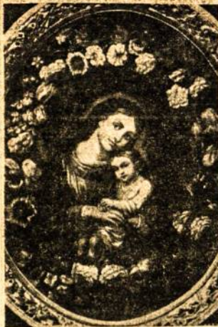
Stebuklingas Šv. Panelės paveikslas Pažaislio šventovėje.

Na, ir tu pats, ar jau esi taip tikras, kad žinai jog viska Marija padarytu, jei tu mokėtum jos paprašyti?