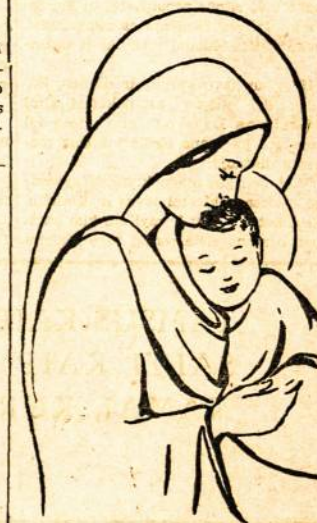
Motina ir Sūnus

Myli motina vaikelį, Myli ja karštai ir jis: Glandžiasi prie jos, kiek gali, Rodos, tuoj ka pasakya.