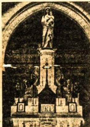
Siluva. — Čia, prie Marijos kojų, ivyko skaitlingi suvažiavimai. Vyras pasiaukojė Marijai pasižadėdami prikelti doriniai puolančia Lietuva; moters įliekojo būdu kaip sukriščiointi šelmyna ir ja pakelti; jaunimas-pagalbos ir palaimos dideliems žygiams.

Turime ir Lietuvoje didelių ir garsių Marijos šventovių: Siluva, Pažaislis, Vilnius... Gerieji skaitytojai, sudarykite savo šeimose nedideles Marijos šventoves, kur aidėtu bent per gegužės mėnesį, Marijos mėnesį, gegužinės pamaldos, gegužinių pamaldų aida. Puoškite Marijos paveikslus, altorius, o ypač savo širdis, kad tuo būdu bent kiek panašėtume i Nekaltai Pradėta šv. Panelė.