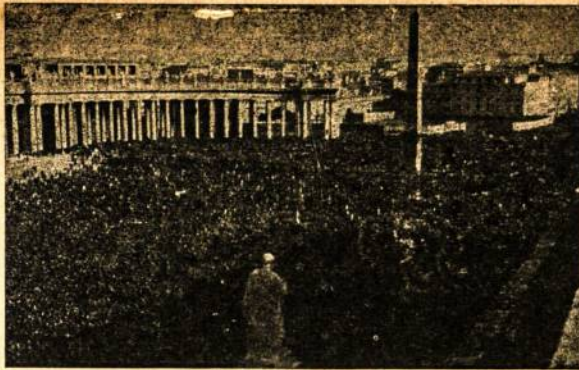
Tūkstantinė minia Romoje, Sv. Petro aikštėje meldžiasi už geresnę žmonijos ateiti

Juo ilgiau mastai, juo daugiau klaui- simu randasi, ir juo margsnis atrodo mūsų motinu ir dukteru gyvenimas išėivijoj. Ir vis dėlto, atrodo, daugelis motinu girdi gimtosios žemės šauksma, o dukterys ilgisi motinu ir mūsų su motinos — tėvynės. Mes tikim, jog lietuvi supranta, kad ne taip svarbu, kokios partijos gims mūsų padangėj, kaip svarbu — kokai duktė ir koks žmogus gims mūsų tėvynėi.