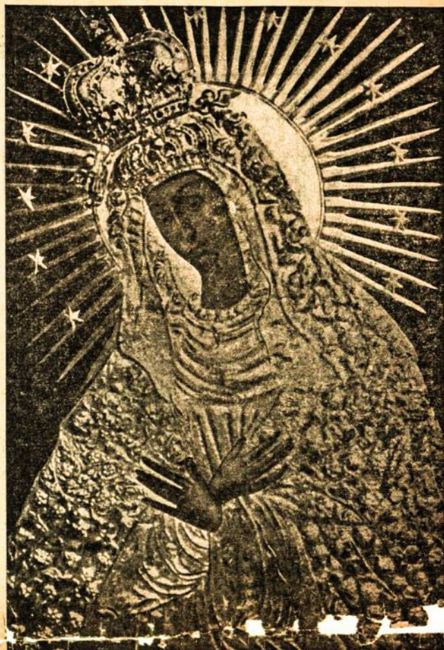
Vilniaus Aušros Vartu Sv. Panelė Marija

Bet širdis nuklys drauge su vėjais, Zais su klevo lapais, vystančiais žiedais, Ir vaidensis mum jog vėl namo parėjom, I būtusias grįzome dienas.