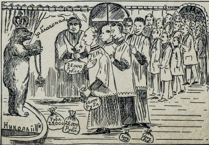
CARAS IR LIETUVIAI „VISUPADONIAUSIEJIE“.

ant 416 PENN Ave. SCRANTON Pa Sztoze užlaiko del pardavimo visokius reikalingus namus daigtus, kaip tai lovas, springsus, kreeses, kanapas stalus, peczius ir tt. puikinius daigtus pardūda už plgiausią preke, ir viską | namus nugabena.